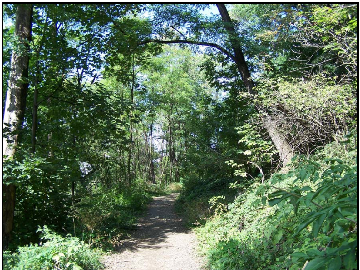
Park pod zámekem