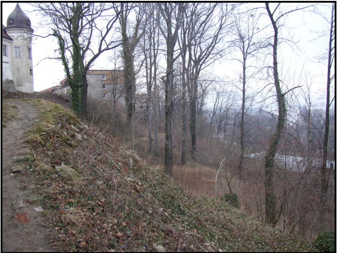
Park pod zámekem