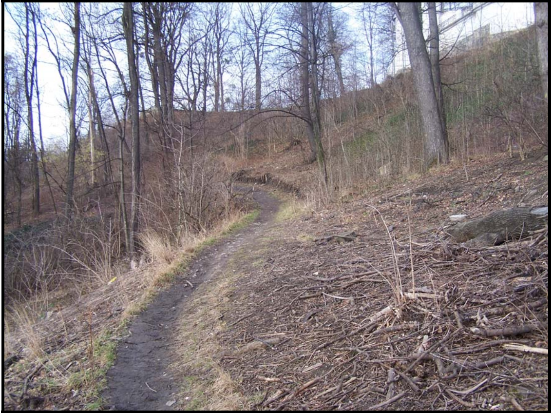
Park pod zámekem