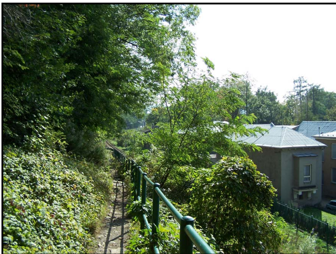
Nad tratí ČD