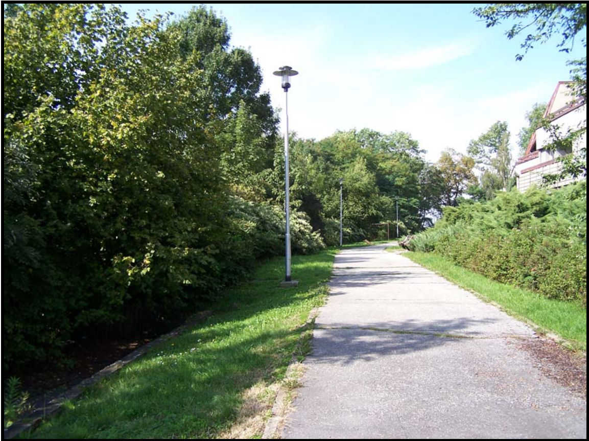
Severní hranice parku – ul. Hasičská