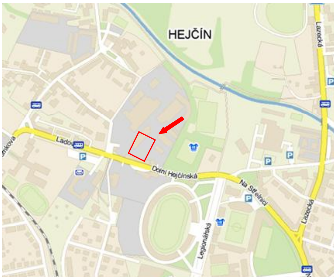
Obr.: Schéma umístění záměru (bez měřítka)

Poloha záměru je zřejmá z následujícího schématu: