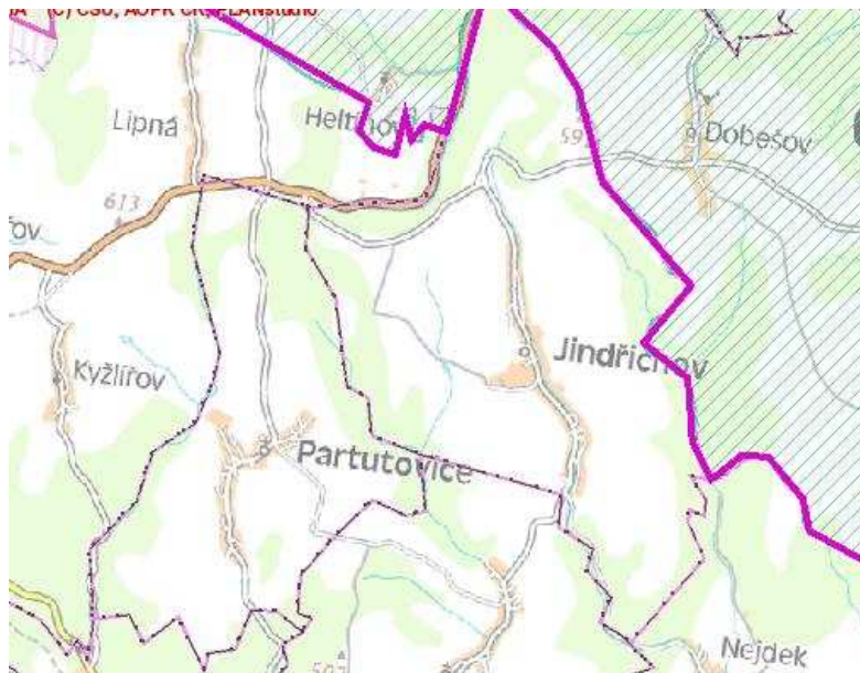
Obr. č. 2: Přibližná poloha k.ú. Kyžlířov a přírodního parku Oderské vrchy

Proto je velmi důležité zjištění, do jaké míry stavba větrných elektráren ovlivní především významné hodnoty krajinného rázu, tj. významné krajinné prvky, zvláště chráněná území, kulturní dominanty krajiny a harmonické vztahy v krajině. Je zřejmé, že posledně jmenovaný prvek se určuje dosti obtížně.