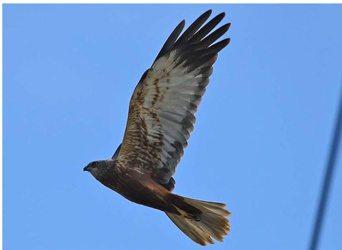
Samec motáka pochopa ( Circus aeruginosus) na lokalitě Studénka, hnízdící jedinec ve stáří 3. kalendářního roku, 9. 4. 2025.