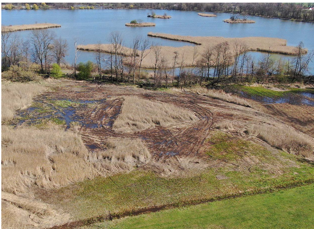
Realizace managementu na lokalitě kompenzačních opatření č. 3., Jistebník, 9. 4. 2025.