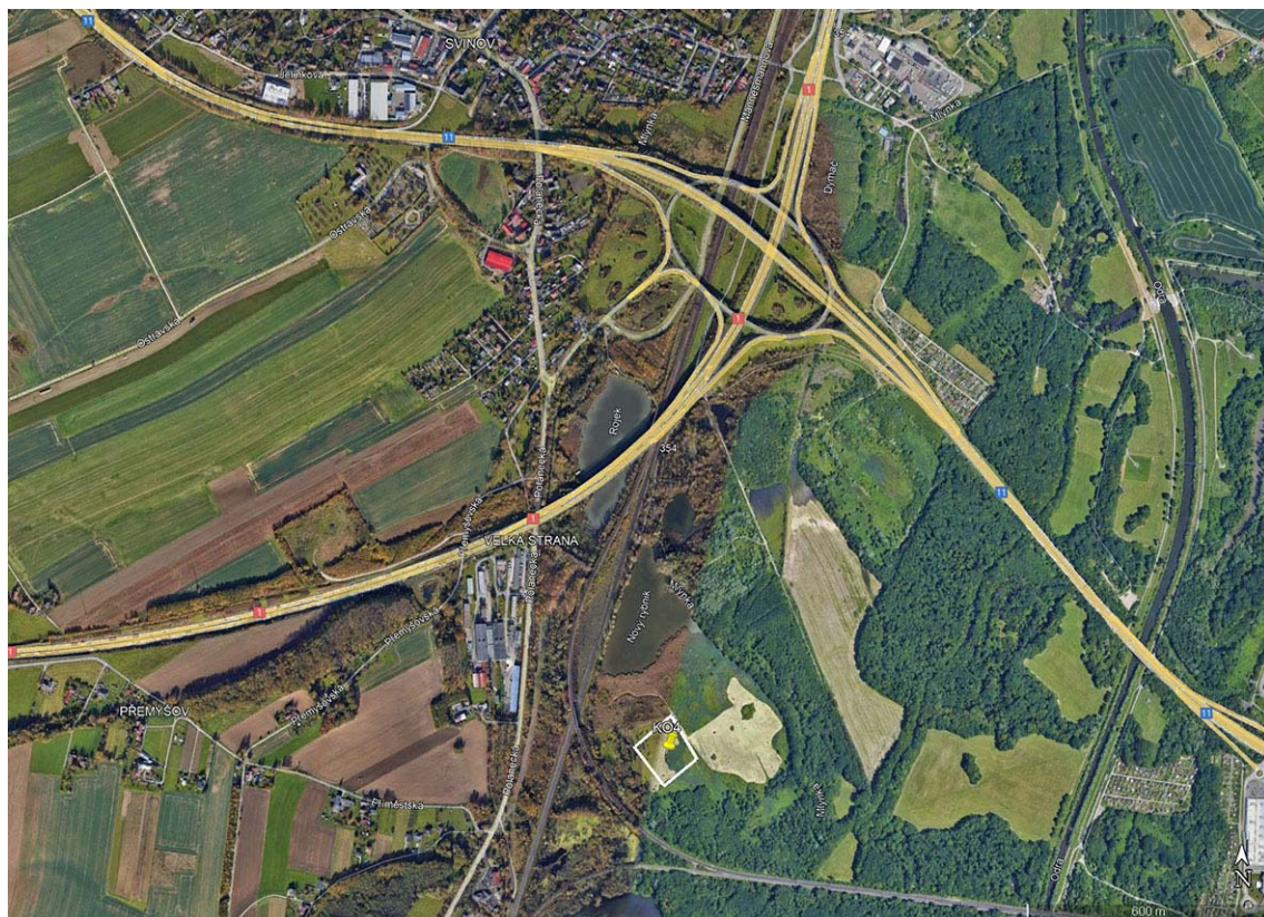
Lokalita Ostrava-Svinov v CHKO Poodří navazuje na Nový rybník, s vyznačenými hranicemi pro realizaci kompenzačního opatření č. 4.

Lokalita zahrnuje rozsáhlou terestrickou rákosinu (a z části i ruderalu) s jednotlivými porosty křovin. Povrchová hladina vody na lokalitě sahá mírně pod terén. Pro hnízdění motáka pochopa je tato lokalita vhodná, a to i pro více párů. Zarůstání lokality křovinami během sukcese motáku pochopovi z hlediska nároků na hnízdní biotop nevyhovuje. Pro zvýšení atraktivity lokality, coby hnízdiště motáka pochopa, navrhuji v prostoru plochy určené pro realizaci kompenzačního opatření a jejího okolí rozšíření stávajícího mokřadního biotopu v podobě několika hlubších tůní, které vytvoří vhodné podmínky pro mokřadní biotu a současně z části zneprůchodní tuto plochu pro pozemní predátory (prase divoké, liška obecná apod.). Soustava podmáčených rákosin a tůní je atraktivním hnízdním biotopem pro motáka pochopa. Realizaci nových tůní je možné provádět technikou anebo odstřelem.