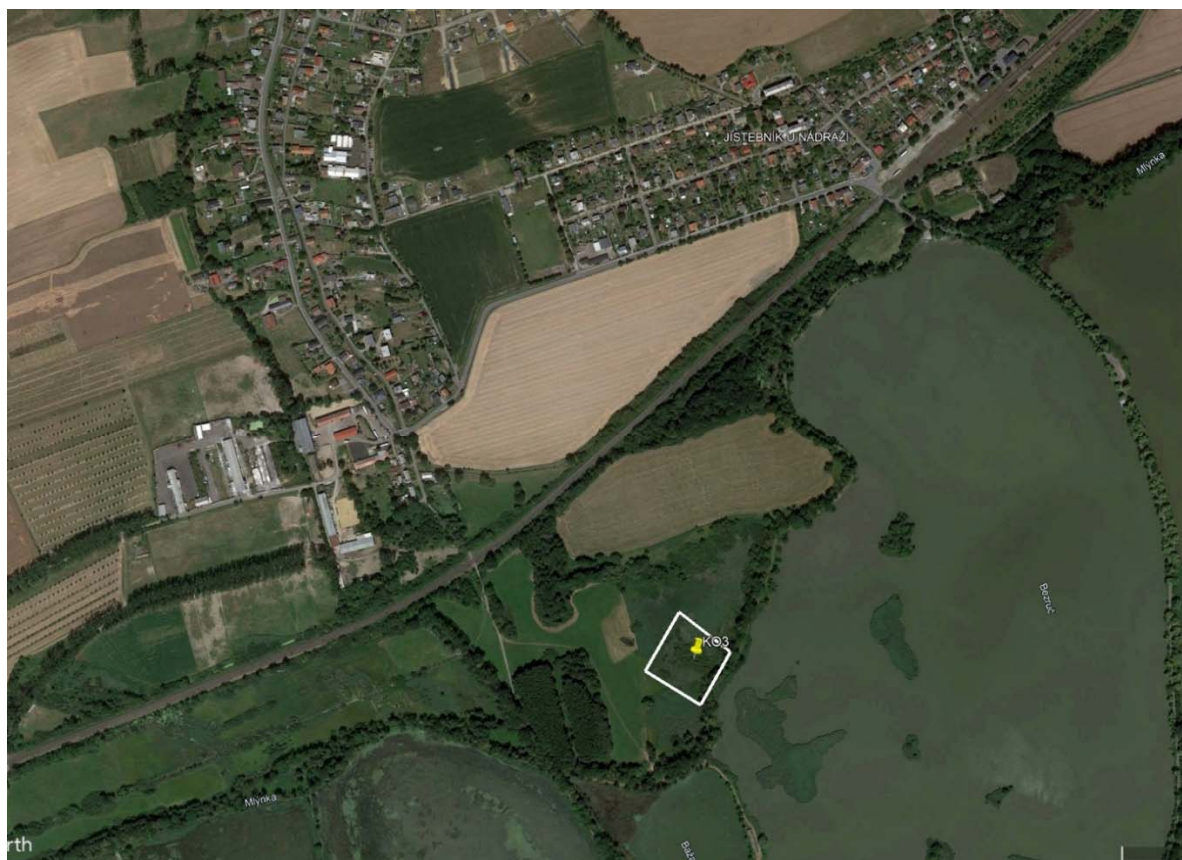
Lokalita Jistebník v CHKO Poodří (rybník Bezruč) s vyznačenými hranicemi pro realizaci kompenzačního opatření č. 3.

Pro zvýšení atraktivity lokality, coby hnízdiště motáka pochopa, navrhuji v prostoru plochy určené pro realizaci kompenzačního opatření vytvořit několik hlubších tůní. Tím vzniknou vhodné podmínky pro mokřadní biotu a současně dojde k částečnému zneprůchodnění této plochy pro pozemní predátory (prase divoké, liška obecná apod.). Soustava podmáčených rákosin a tůní je atraktivním hnízdním biotopem pro motáka pochopa. Realizace nových tůní je možné provádět technikou nebo odstřelem.