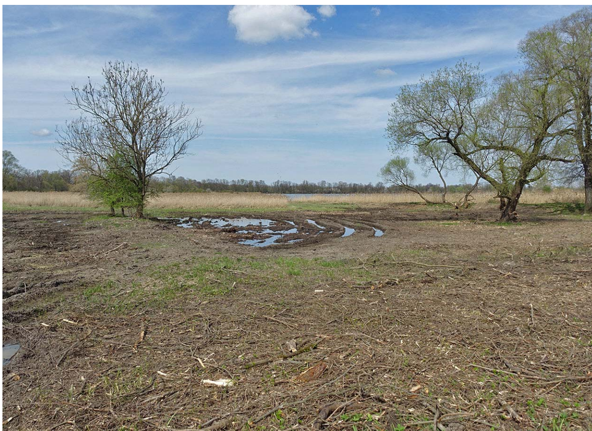
Realizace managementu na lokalitě kompenzačních opatření č. 2., Bartošovice, 9. 4. 2025.