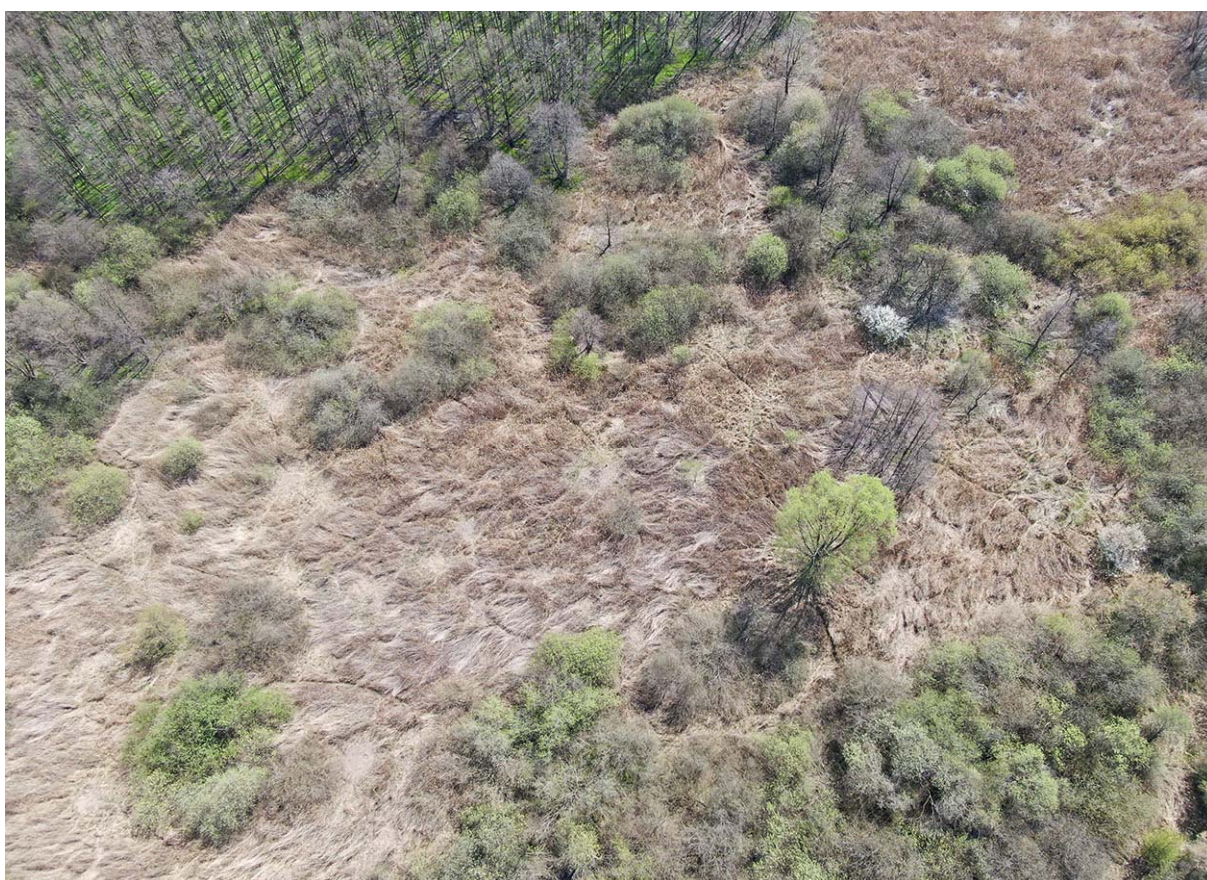
Pohled na lokalitu určenou pro realizaci kompenzačních opatření č. 1., Studénka, 9. 4. 2025.