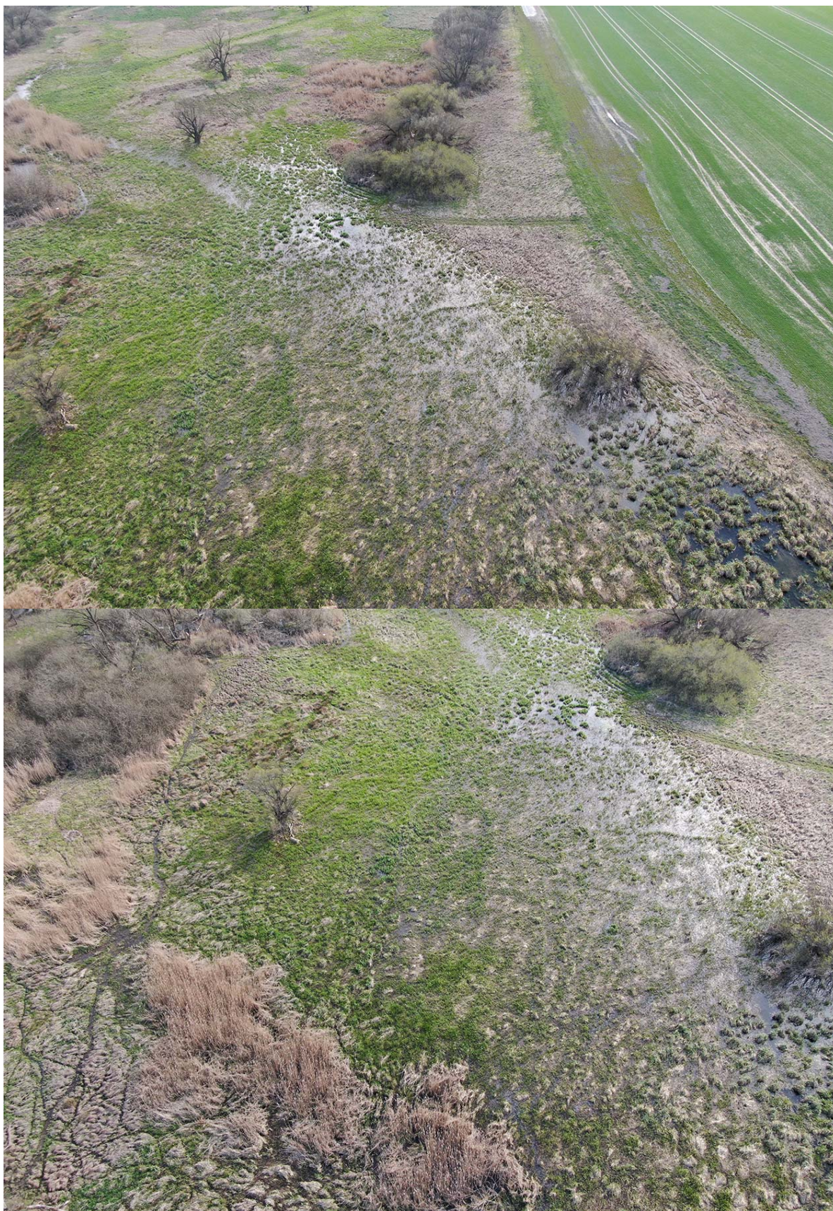
Stávající rozsáhlý mokřad na západní straně nově plánované bezúvratové spojky Přerov – Sedlnice“. Požadavkem je, aby tento významný mokřad zůstal zachován ve stávající podobě i po realizaci stavby a nedošlo k jeho degradaci, 9. 4. 2025.