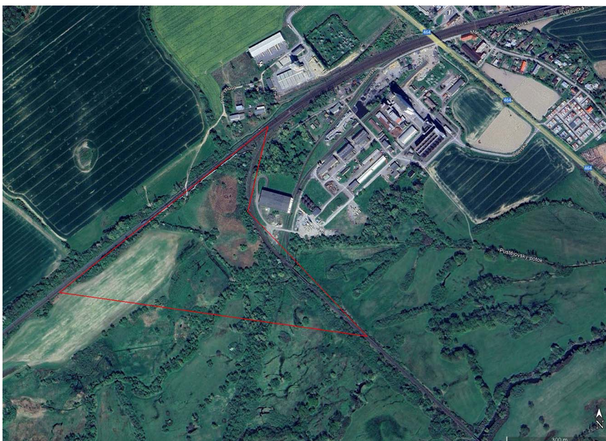
Lokalita Studénka v CHKO Poodří s vyznačenými hranicemi oblasti průzkumu pro hodnocení záměru „Zapojení terminálu kombinované dopravy Mošnov“.