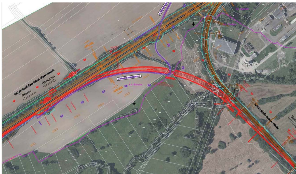
Nová bezúvrat'ová spojka Přerov – Sedlnice, zdroj: Fialová 2023.