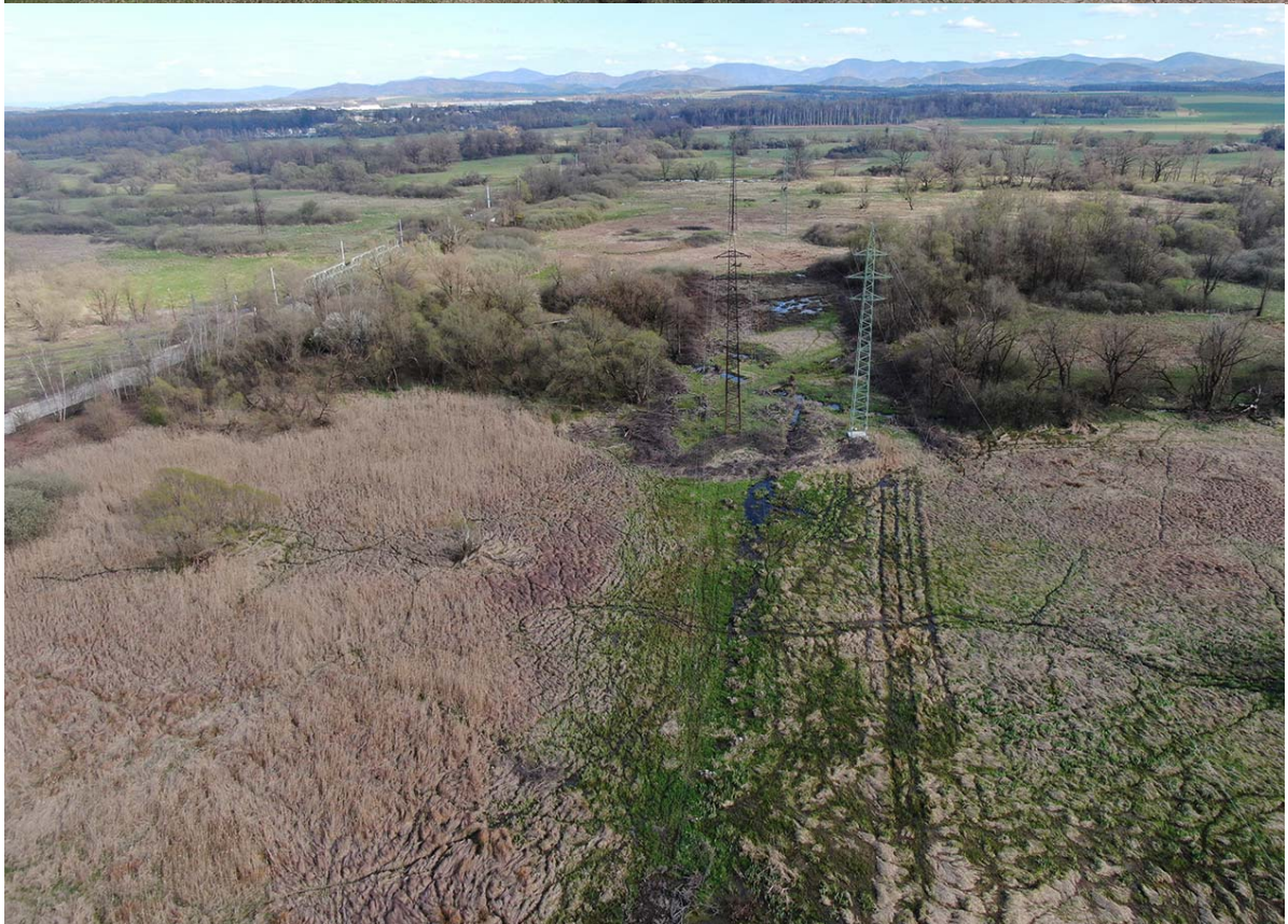
Stávající rákosový porost (z větší části spíše terestrický) na západní straně nově plánované bezúvrat'ové spojky Přerov – Sedlnice“, patrná je stávající spojka a elektrické vedení procházející přes lokalitu. Dále jsou patrné cesty vychozené zvěří napříč lokalitou (obdobně i na dalších foto), 9. 4. 2025.