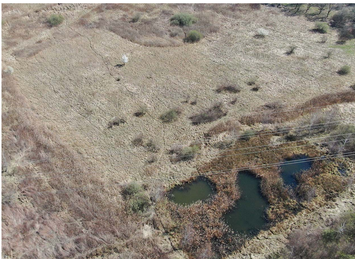
Pohled na lokalitu určenou pro realizaci kompenzačních opatření č. 4., Ostrava-Svinov, 9. 4. 2025.