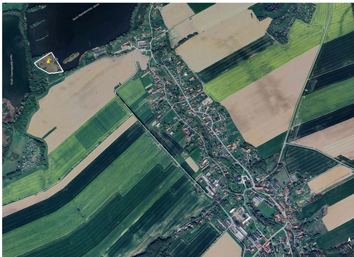
Lokalita Bartošovice v CHKO Poodří (Dolní Bartošovický rybník) s vyznačenými hranicemi pro realizaci kompenzačního opatření č. 2.

Lokalita je charakterem biotopu pro hnízdění motáka pochopa velmi vhodná. Zarůstání lokality po okrajích dřevinami v rámci sukcese je možno redukovat vhodným managementovým opatřením, včetně vhodného managementu rákosových porostů.