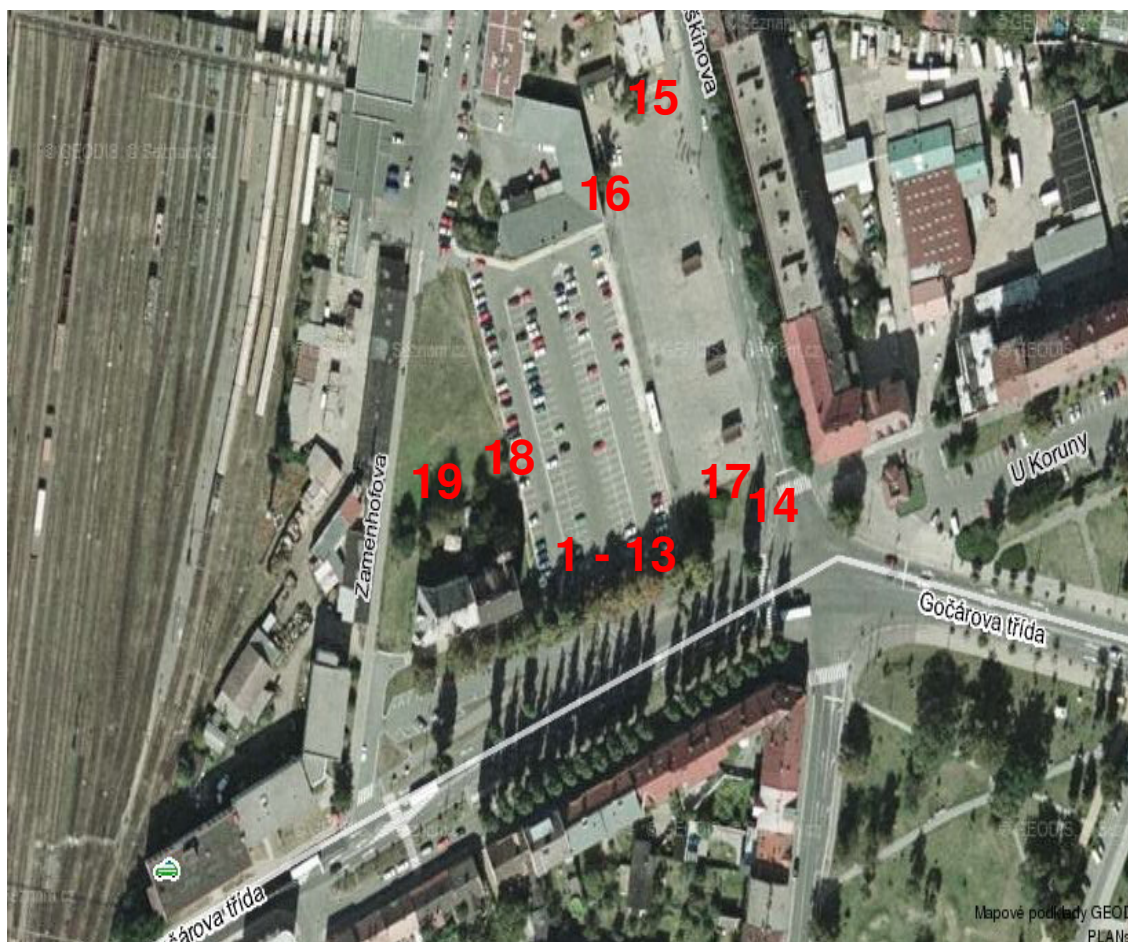
Celková situace rozmístění stromů