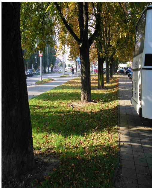
Kaštanová alej – celkem 13 stromů

V prostoru budoucího staveniště se nachází 2 ks břízy bradavičnaté, 1 ks vrby bílé a 1 ks třešně. Ostatní jsou náletové dřeviny, které nemají žádnou významnou hodnotu.