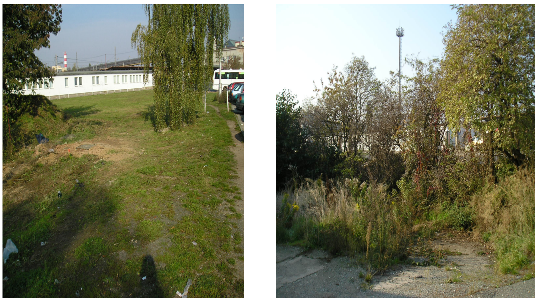
Charakteristické plochy zájmového území