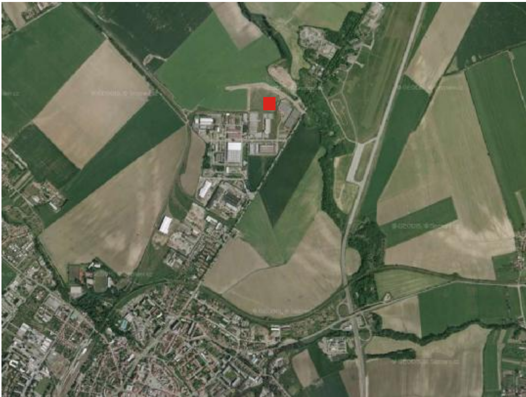
Obr.: Umístění záměru (bez měřítka)

Poloha záměru je zřejmá z následujícího obrázku: