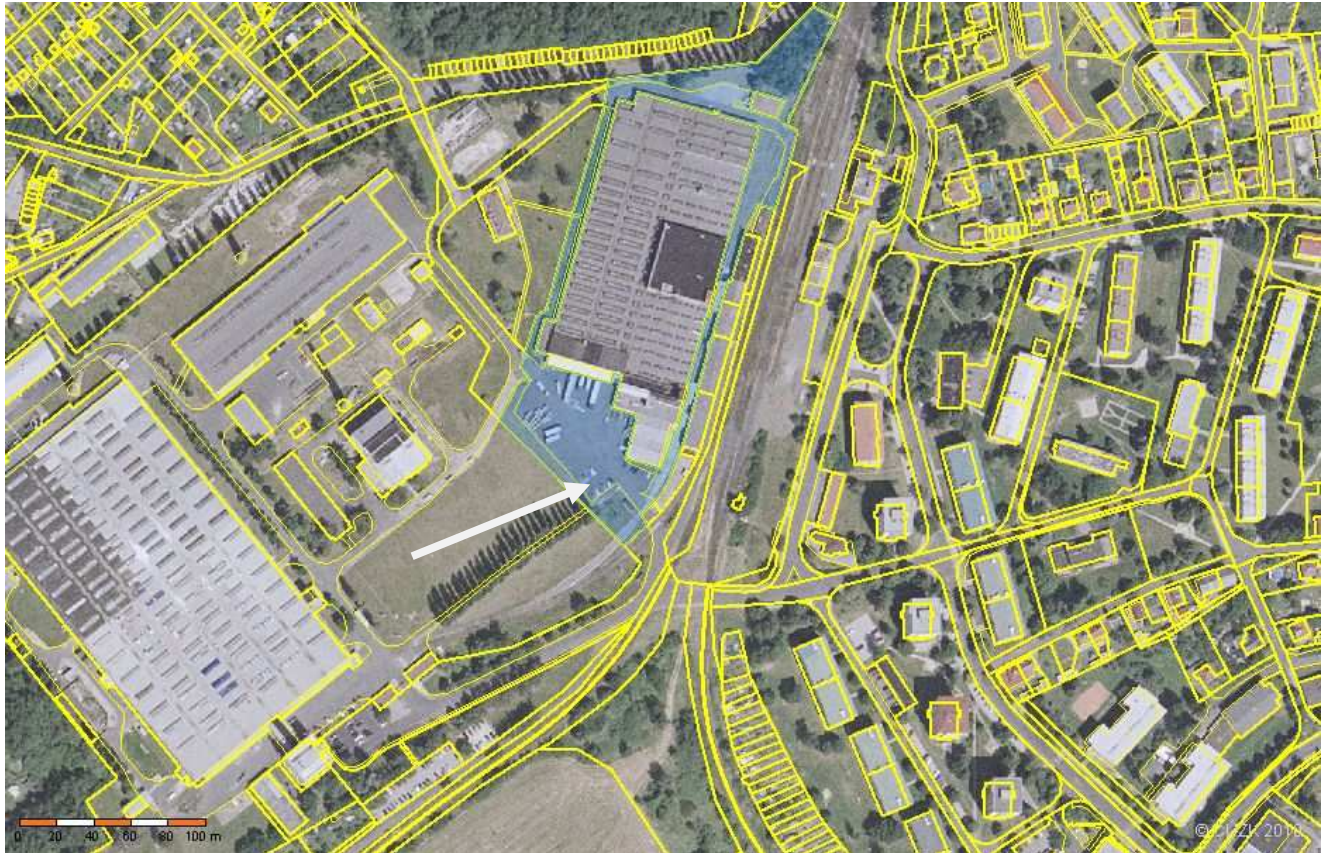
Obr. č. 2b Mapa předmětné lokality s umístěním záměru