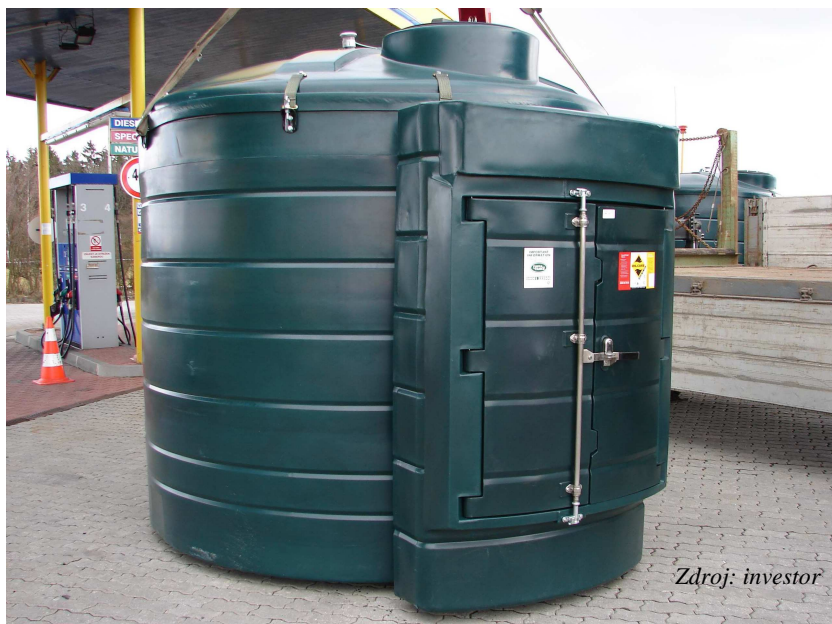
Obr. č.3a: Nádrž typu VBFS 6 000