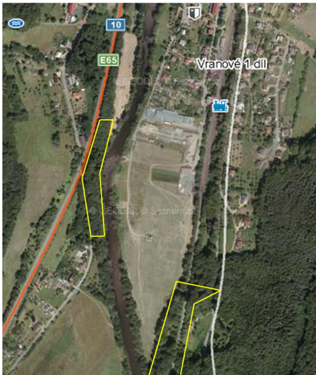
Obr. 2: Zákres stanoviště bučiny Asperulo-Fagetum (žlutě) v okolí variant 1 a 2 záměru Přemostění Jizery – Malá Skála.