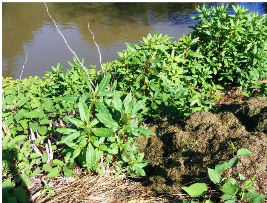
Obr. 1: Břehy Jizery jsou hojně porostlé netýkavkou žláznatou a zástupci rodu křídlatka

Stanoviště bučiny Asperulo-Fagetum se nachází v okolí plánované komunikace v obou variantách záměru. Ovlivněno může být pouze nepřímo produkcí emisí výfukových plynů s projíždějících nákladních automobilů a šířením invazních druhů rostlin v okolí nově budované komunikace. Tyto druhy (zástupci rodů křídlatka, netýkavka) se v okolí záměru hojně vyskytují na březích Jizery.