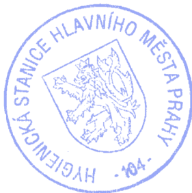
MUDr. Stanislava Křinková oddělení hygieny komunální pobočky Praha - centrum

ke kolaudaci musí být měřením doloženo, že hluk ze všech stacionárních zdrojů hluku nepřesahuje v chráněných vnitřních prostorech staveb hygienické limity hluku stanovené v § 11 odst. 3 a přílohy č. 5 nařízení vlády č. 502/2000 Sb., o ochraně zdraví před nepříznivými účinky hluku a vibrací a dále musí být měřením doloženo, že hluk z dopravy v chráněných vnitřních prostorech staveb (obytné místnosti včetně kuchyní orientovaných do ulic Na Manínách a V Háji) nepřekračuje hygienické limity hluku stanovené v § 11 odst. 2 nařízení vlády č. 502/2000 Sb.