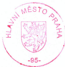
Ing. Jana C i b u l k o v á vedoucí oddělení posuzování vlivů na životní prostředí

Proti tomuto usnesení, které se pouze poznamenává do spisu, se nelze podle ustanovení § 76 odst. 5 správního řádu odvolat.