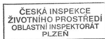
Ing. Tomáš Kameník zástupce ředitele oblastního inspektorátu

Oddělení integrace, oddělení ochrany ovzduší, oddělení ochrany vod, oddělení odpadového hospodářství, oddělení ochrany přírody a oddělení ochrany lesa nemají k oznámení záměru jiných připomínek a nepožadují jeho další posouzení dle zákona č. 100/2001 Sb.