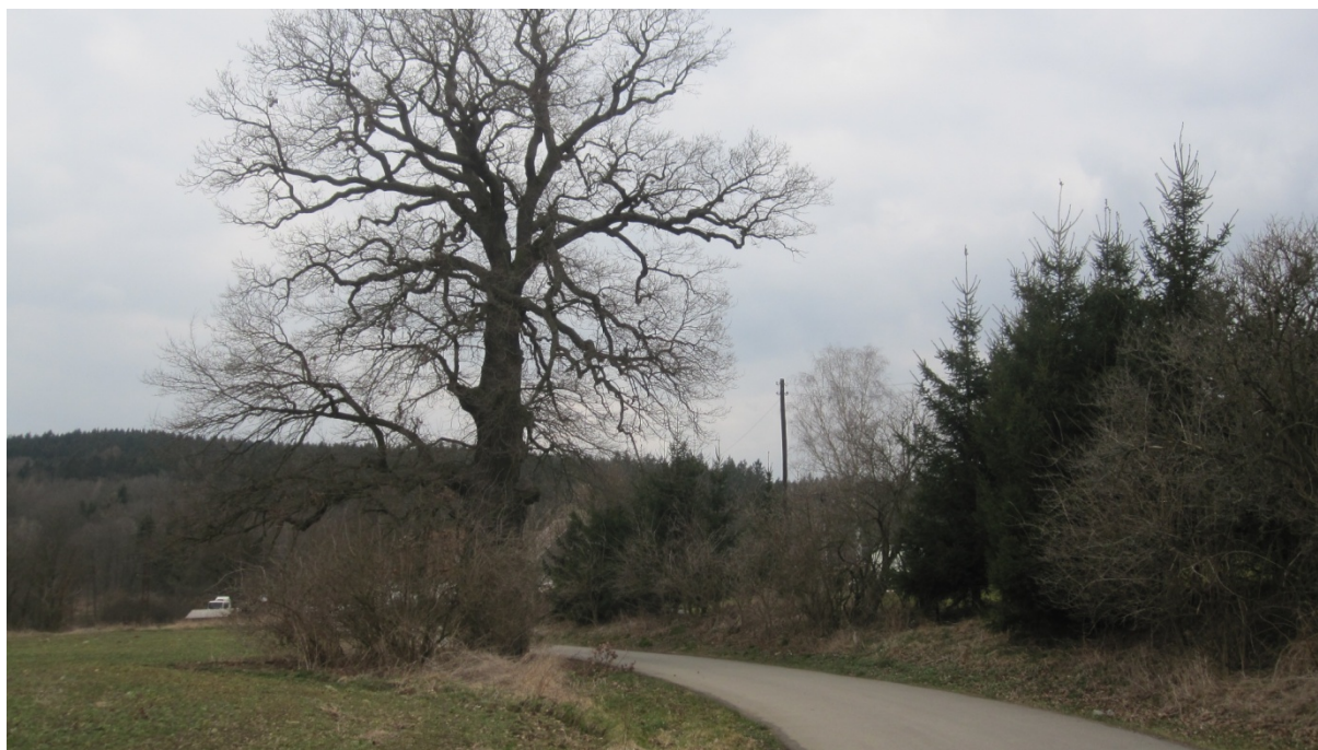
památný dub Čechov, trasa plynovodu je vedena za porostem na pravé straně silnice