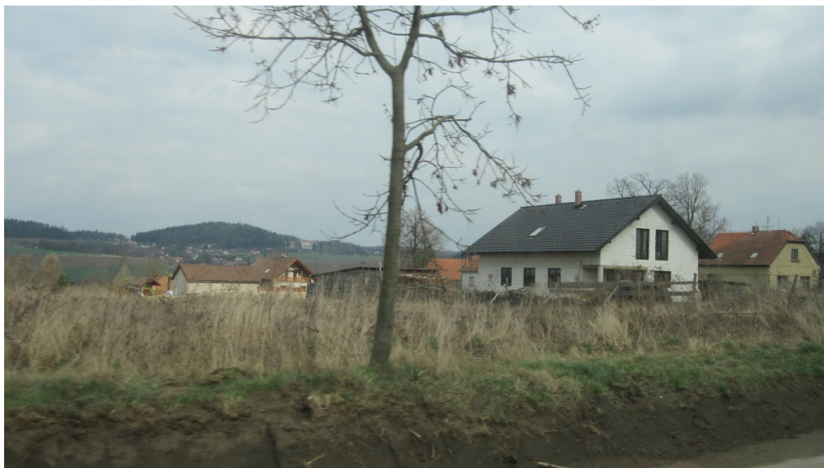
nejbližší Pavlovické domy k příjezdové komunikaci