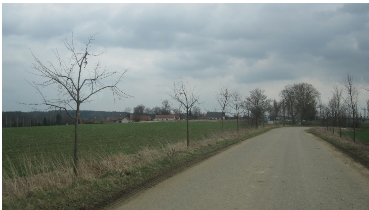
pohled z konce příjezdové komunikace směrem na Pavlov