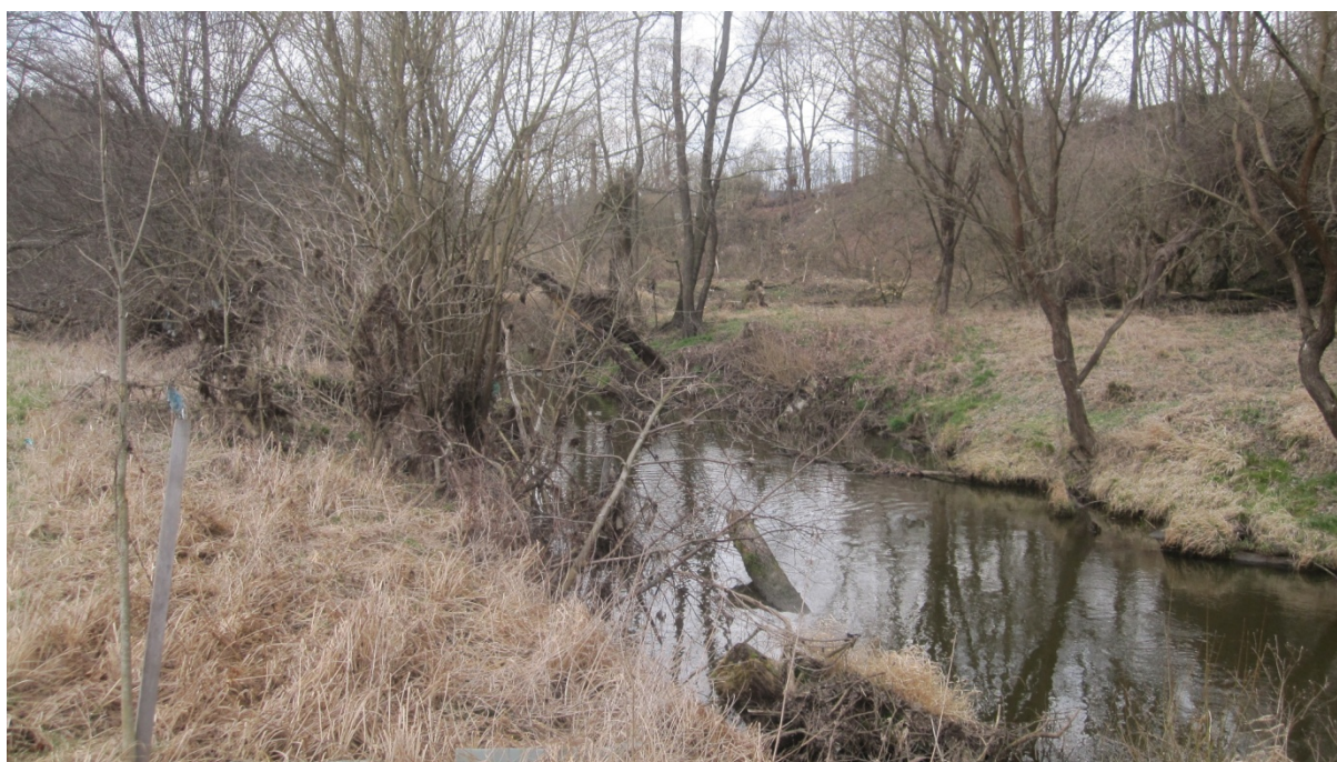
pohled na řeku Blanice v místě křížení s plynovodem, protlakem