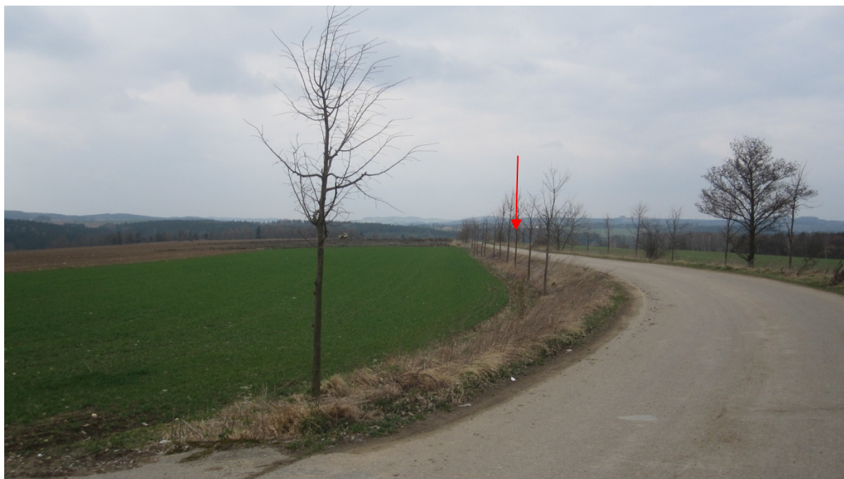
Pohled z okraje rozvojové zóny Pavlovice směrem k záměru, který leží za horizontem v údolí ve směru šipky 30-40 výškových metrů níže (pohled je focen z křížení příjezdové komunikace a silnice II/125)