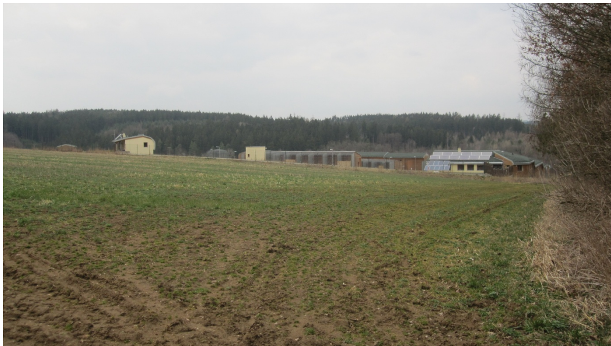
Pohled na prostor plánované výstavby BPS (polní pozemky), v pozadí Záchraná stanice pro živočichy a dále za ní zařízlé údolí Blanice a zalesněné svahy směrem na Ctiboř