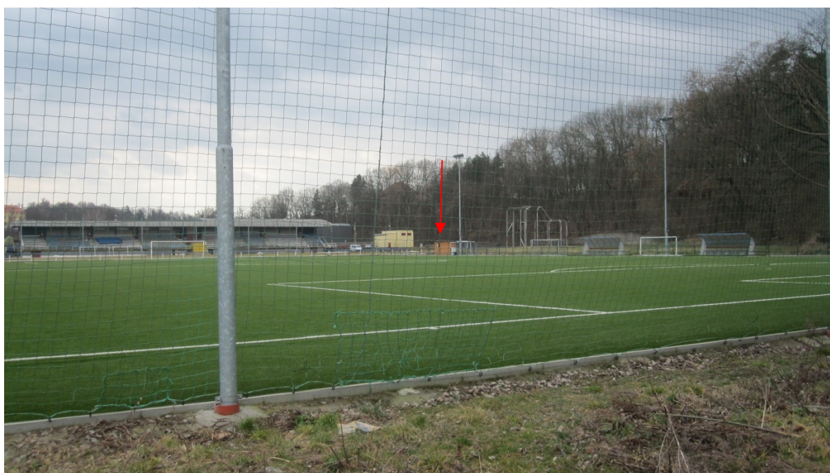
sportovní areál Luka ve Vlašimi, šipkou je označeno místo kde bude umístěna kogenerační stanice KJ2