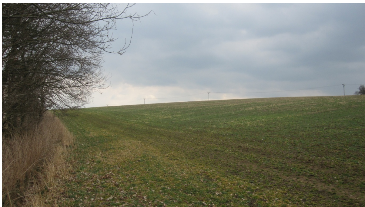
Pohled z prostoru výstavby směrem na Pavlovice, vlevo za porostem příjezdová komunikace a vpravo les