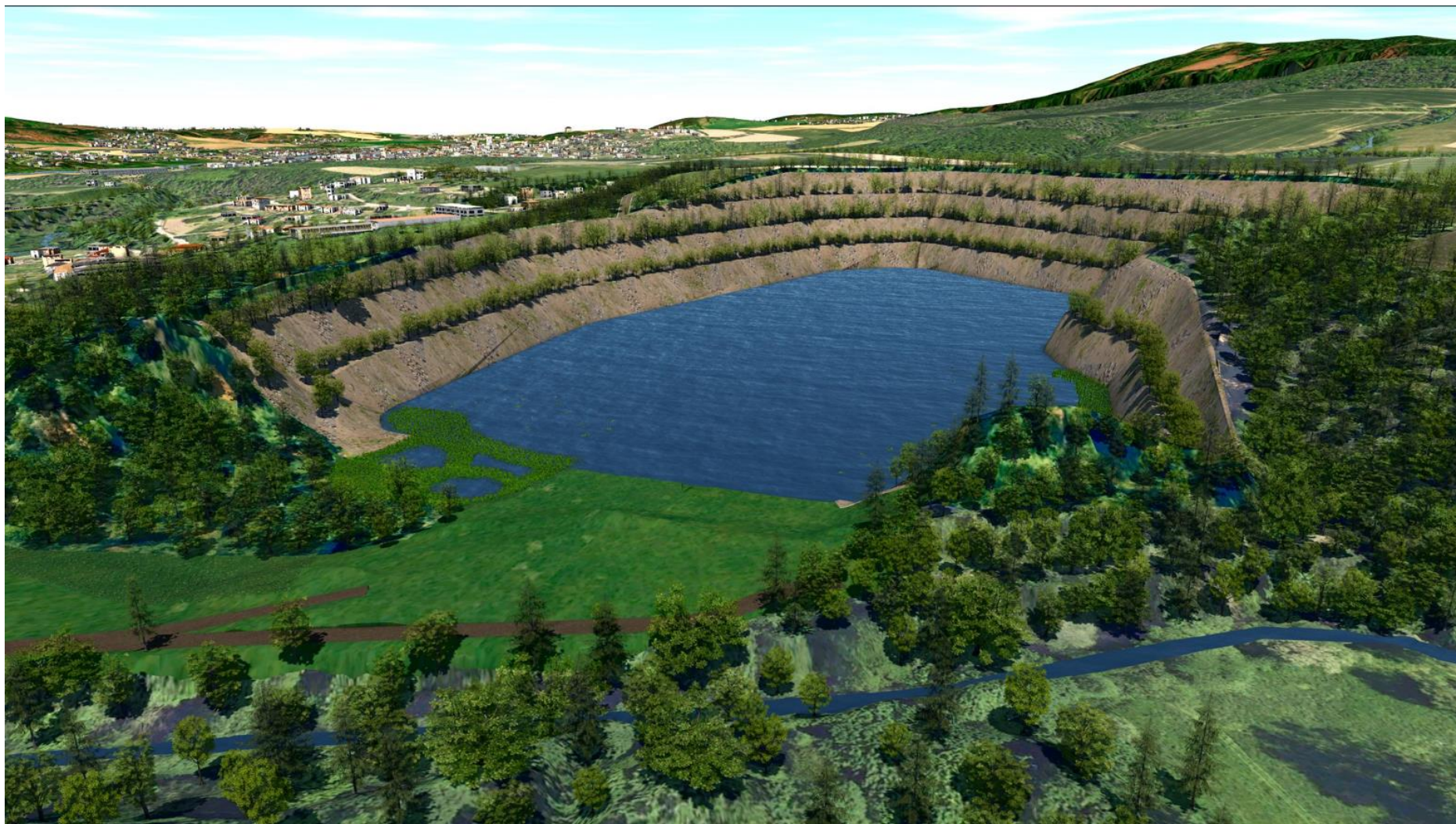
Pohled z výšky od Jihu do lomu - pozvolný přístup k vodní hladině