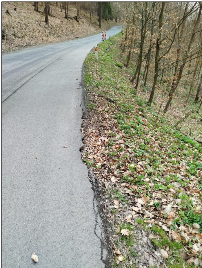
1. Silnice II/201 Zbečno – Píska – trhání krajnice