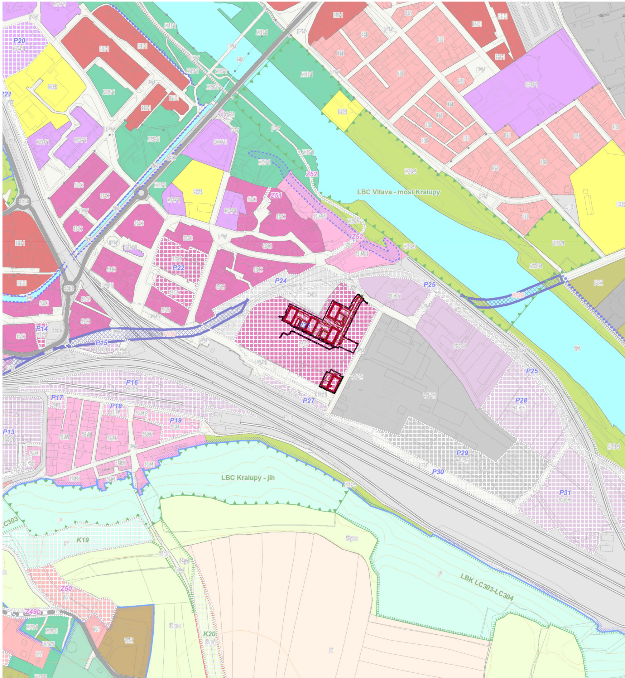
SITUACE – ZÁKRES ZÁMĚRU DO ÚZEMNÍHO PLÁNU