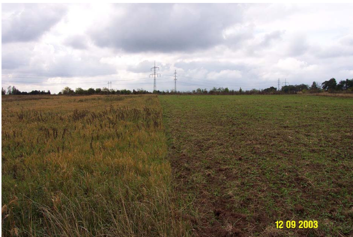
Pohled na jižní část pozemku plánované stavby