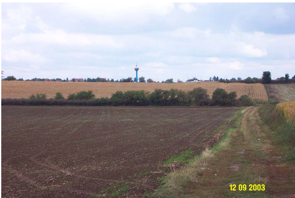
Pohled ze severní části pozemku na protilehlé území