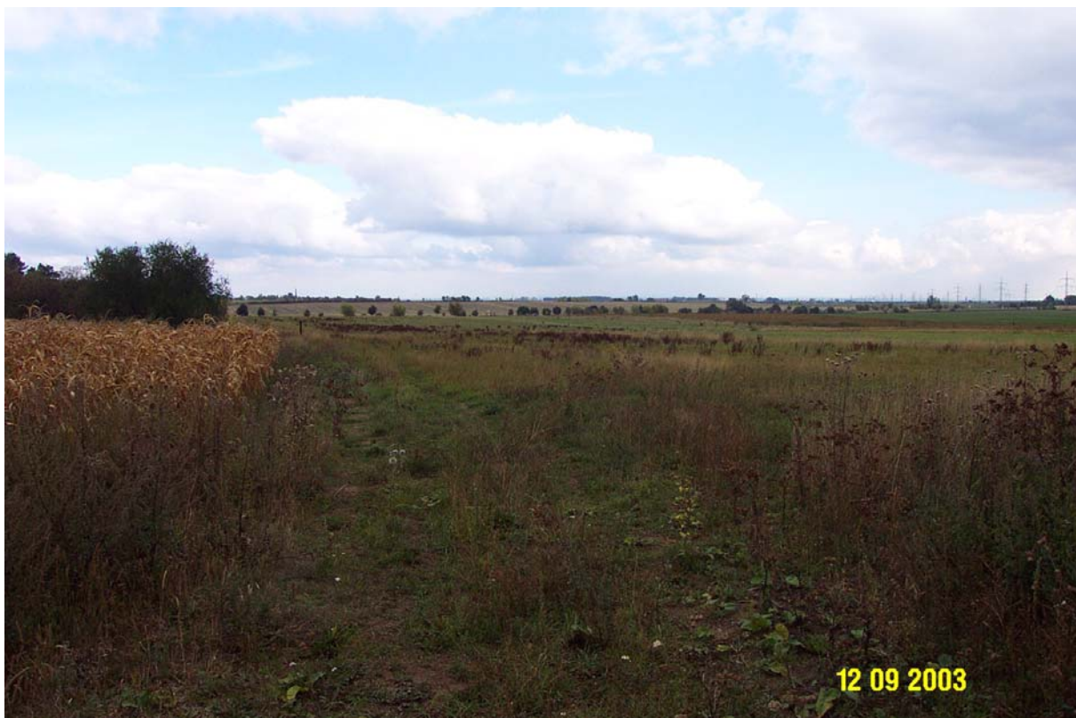
Pohled z JZ části pozemku směrem ke komunikaci II/611 Poděbradská