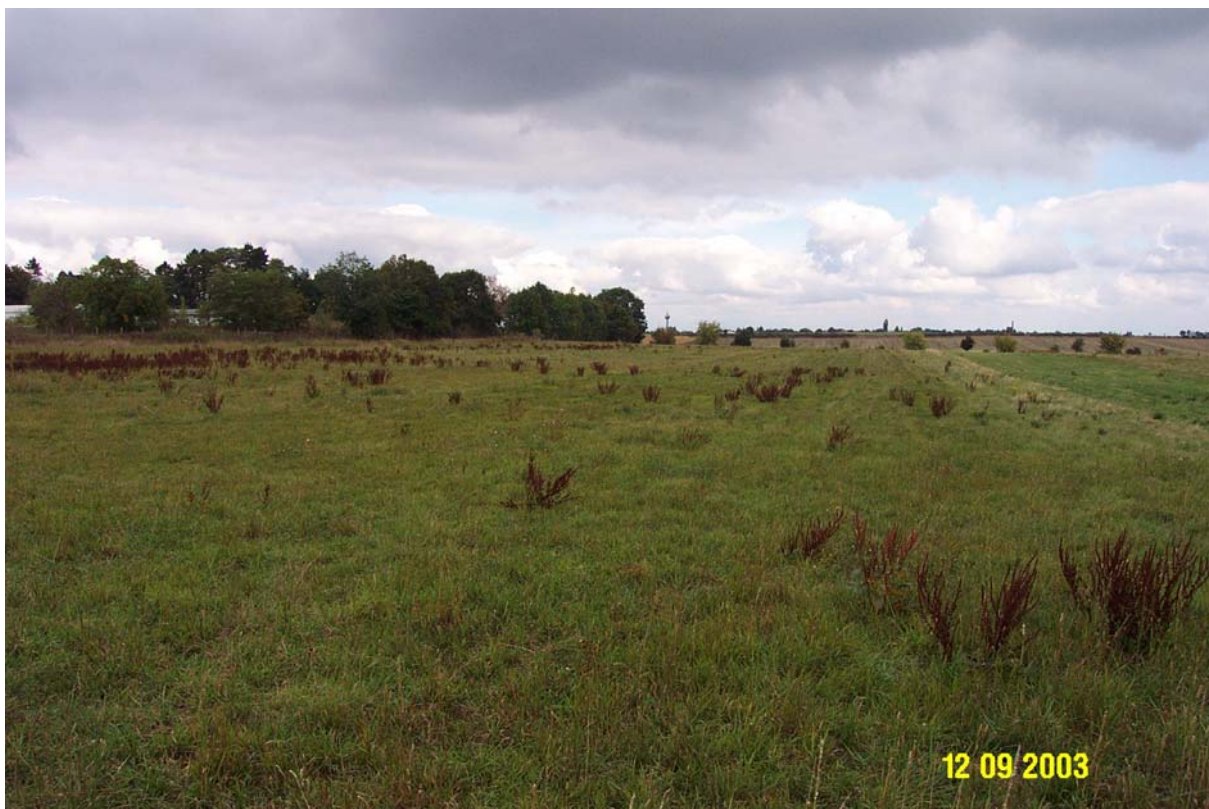
Celkový pohled na pozemek z jeho jižního okraje