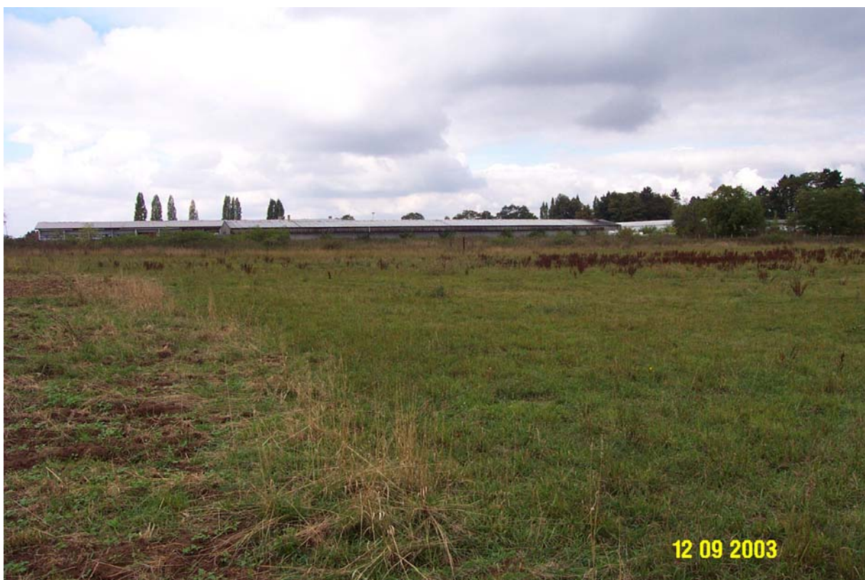
Pohled na sousední skladový areál