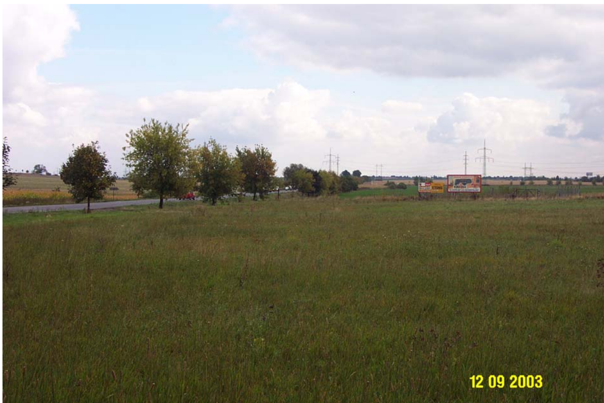
Severní okraj pozemku se silniční komunikací II/611