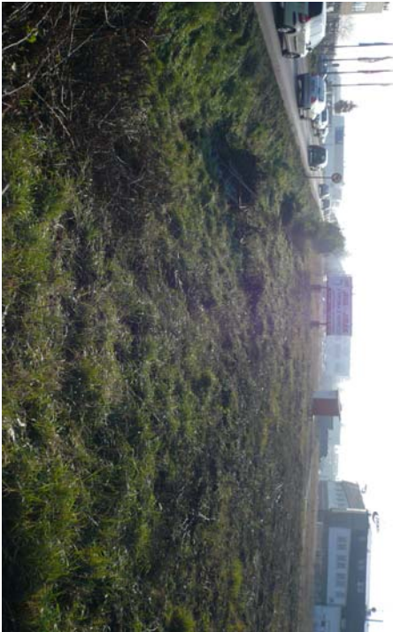
POZEMEK - PŘEDNÍ ČÁST