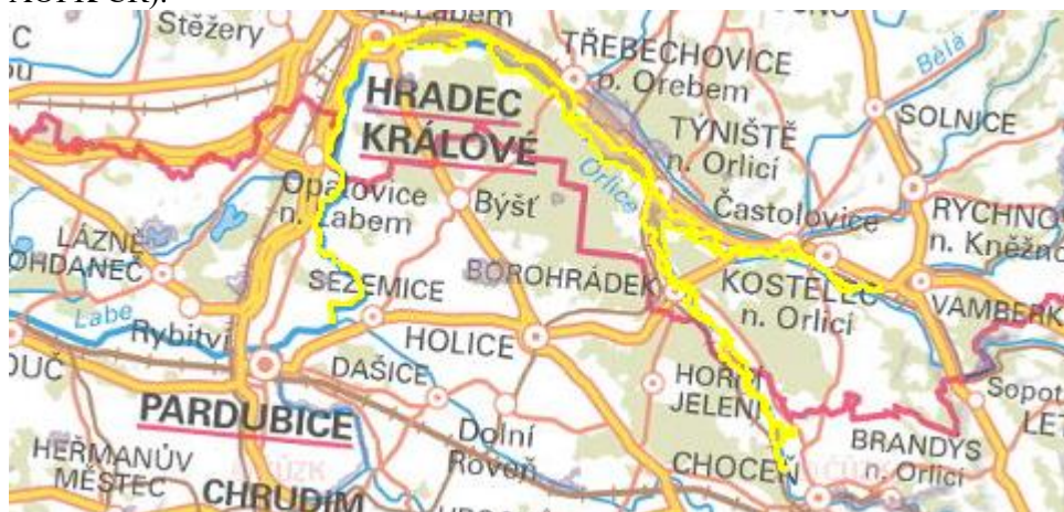
Obr. 1: Schematická mapa hranice evropsky významné lokality EVL Orlice a Labe (zdroj: AOPK ČR).

V následující tabulce je uveden přehled všech předmětů ochrany EVL. Na základě případné přítomnosti přírodních stanovišť v trase nové části koridoru DS11 a na základě znalosti bionomie jednotlivých druhů je stanoveno riziko potenciálního dotčení konkrétních předmětů ochrany hodnocenou koncepcí.