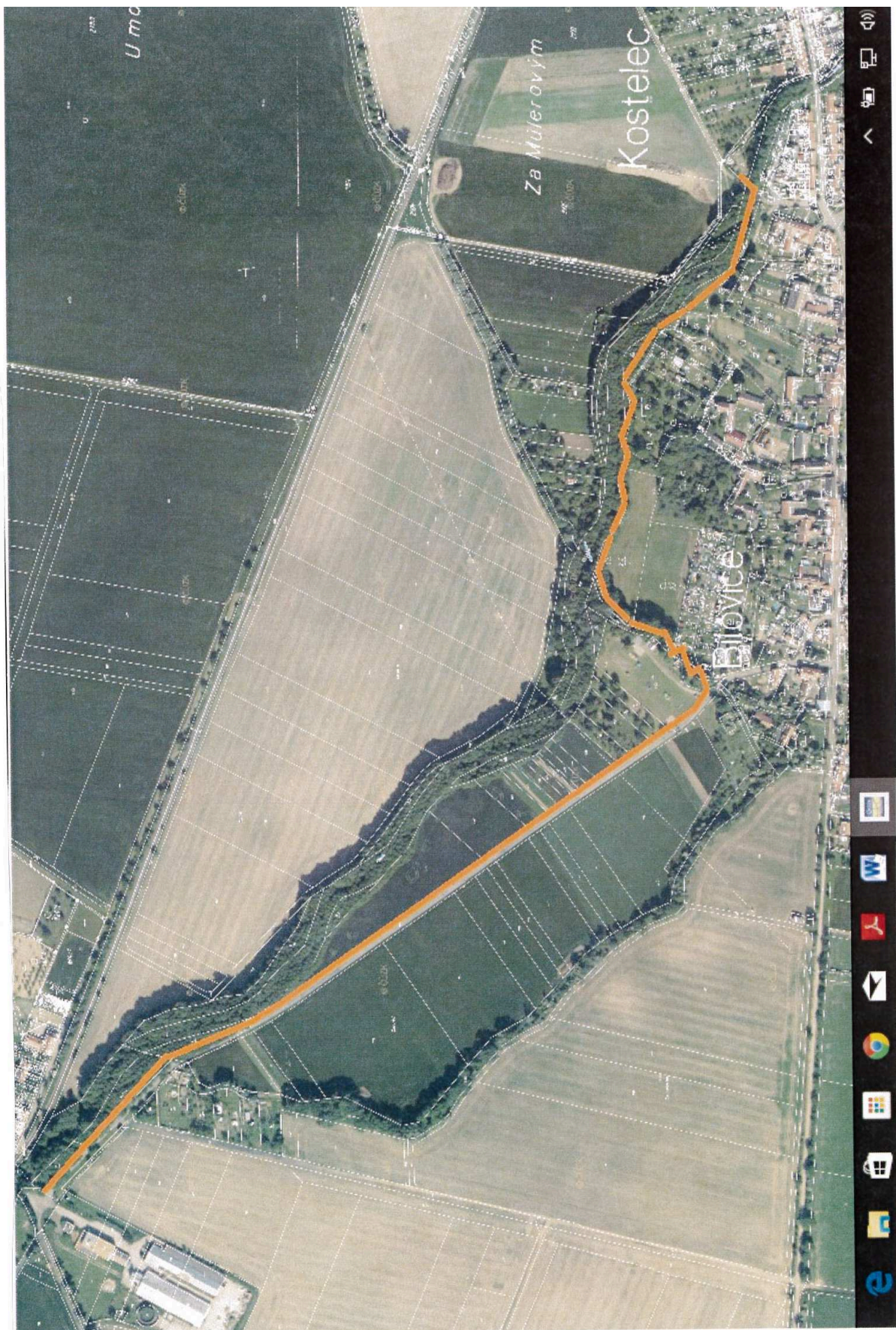
GRAFICKÁ PŘÍLOHA: lokalita č. 1.02 – doplnění trasy cyklostezky