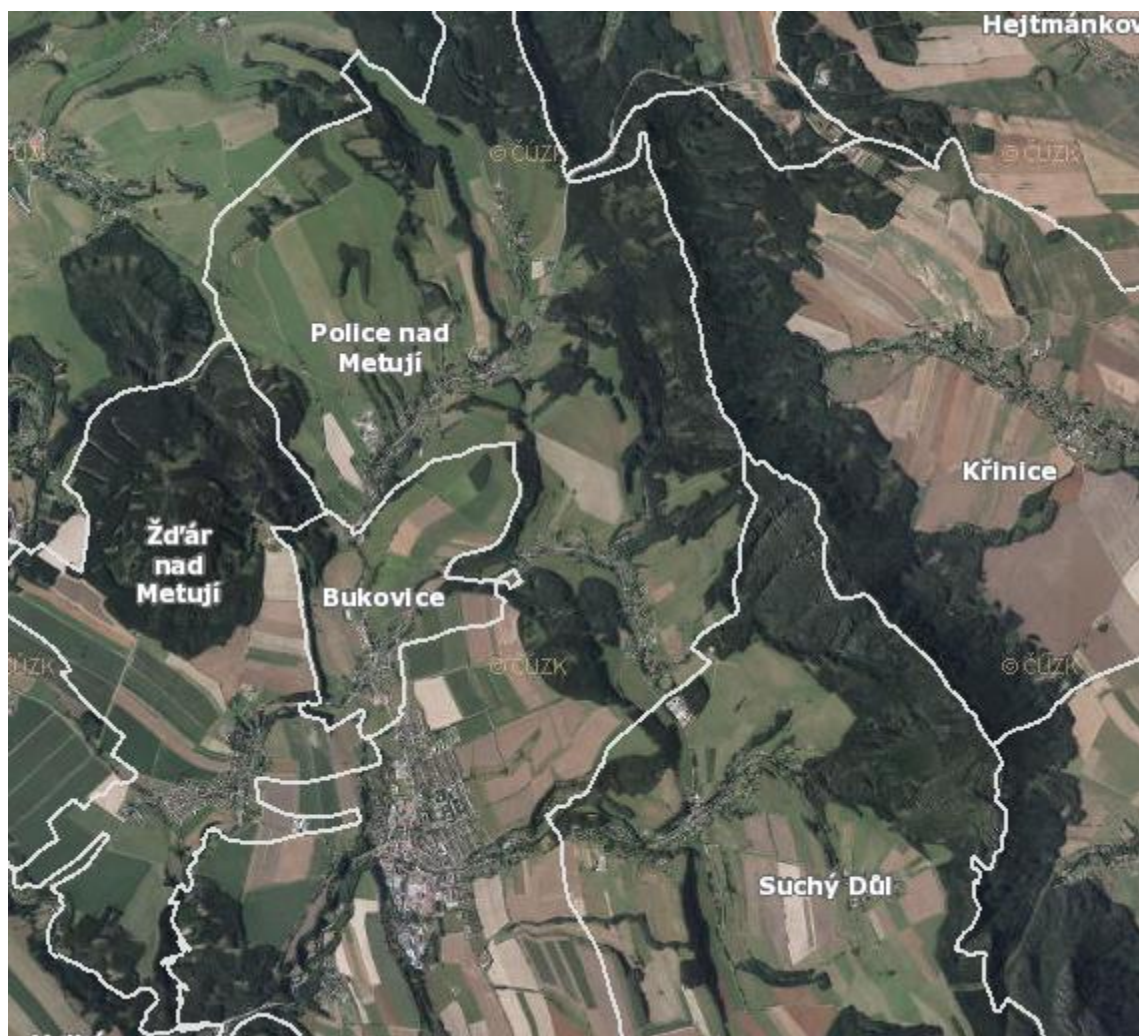
Obr. č. 1: Pohled na město Police nad Metují