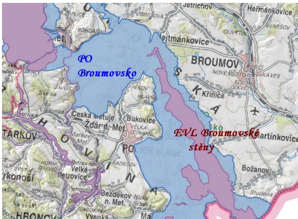
Obr. č. 5: Poloha města Police nad Metují vzhledem k lokalitám Natura 2000

Dotčený orgán Agentura ochrany přírody a krajiny ČR, regionální pracoviště Východní Čechy, oddělení Správa CHKO Broumovsko vyloučil , na základě stanoviska č.j. 02227/VC/17 ze dne 17.5.2017 významný vliv Změny č. 1 na evropsky významné lokality a na vyhlášené ptačí oblast.