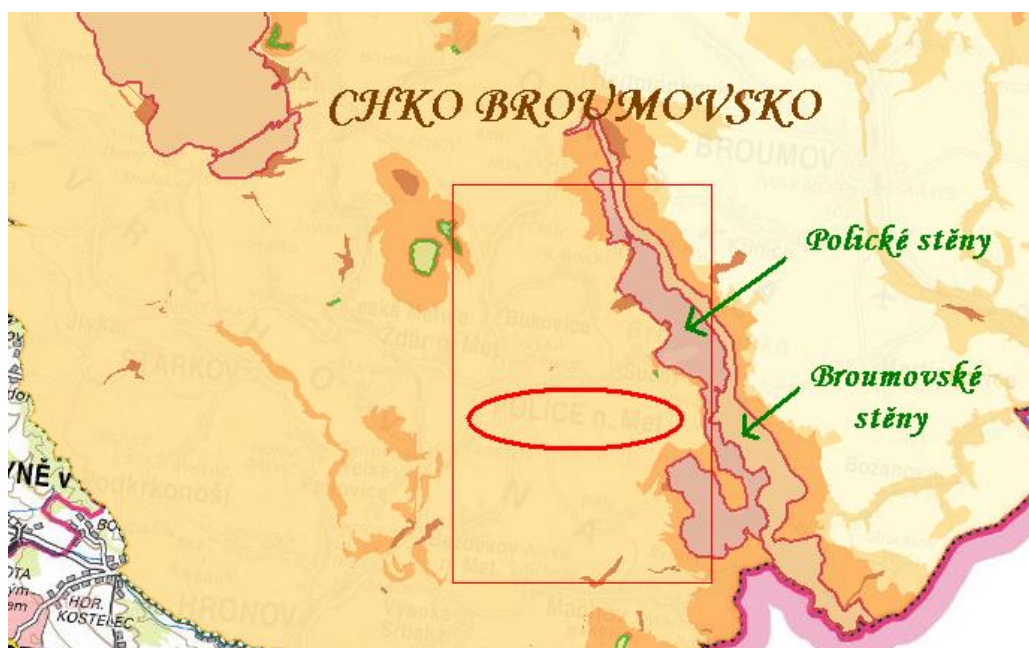
Obr. č. 4: Poloha města Police nad Metují vzhledem k ZCHÚ