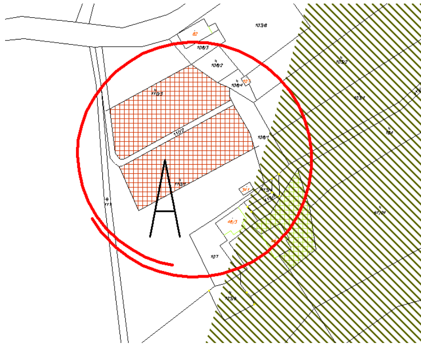
obr. A – lokalita pod silnicí 1/4

b) změna funkčního využití ze sportovní plochy na veřejné prostranství v lokalitě stávajících chatek na břehu toku Vltavy (viz obr. B)