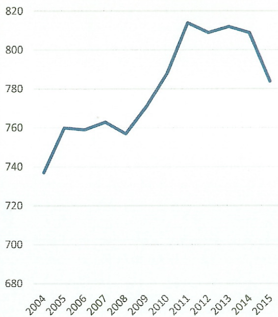
Vývoj počtu obyvatel

Ad iii. Správním území obce Záhoří se podle územně analytických podkladů obce s rozšířenou působností Písek nenachází v oblasti se zhoršenou kvalitou ovzduší. V zadání územního plánu Záhoří není uplatněn požadavek na vymezení nebo rozšíření skládky, spalovny, odkaliště, objektu s umístěnými nebezpečnými látkami skupiny A nebo B, spalovny, ploch výroby a skladování nebo zemědělské výroby mající negativní vliv na své okolí nebo jiného záměru, který by mohl mít potenciálně negativní vliv na životní prostředí, překročení norem kvality životního prostředí nebo mezních hodnot.