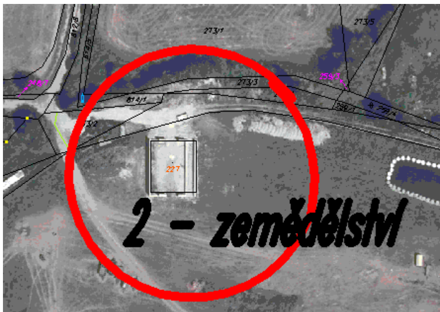
Obr. 2 – snímek ortofoto

rozšíření stávající zemědělské stavby o kryté hnojiště, sklad, senážní žlab a zpevněné plochy.