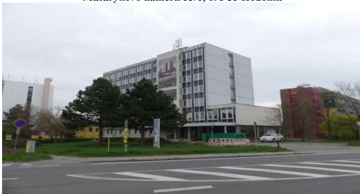
Pohled na klíčový objekt Změny č. 4 ÚP Hodonín od SSZ přes ulici Bratislavskou (M. Macháček, 04/2022)

Městský úřad Hodonín, odbor rozvoje města, Masarykovo náměstí 53/1, 695 35 Hodonín