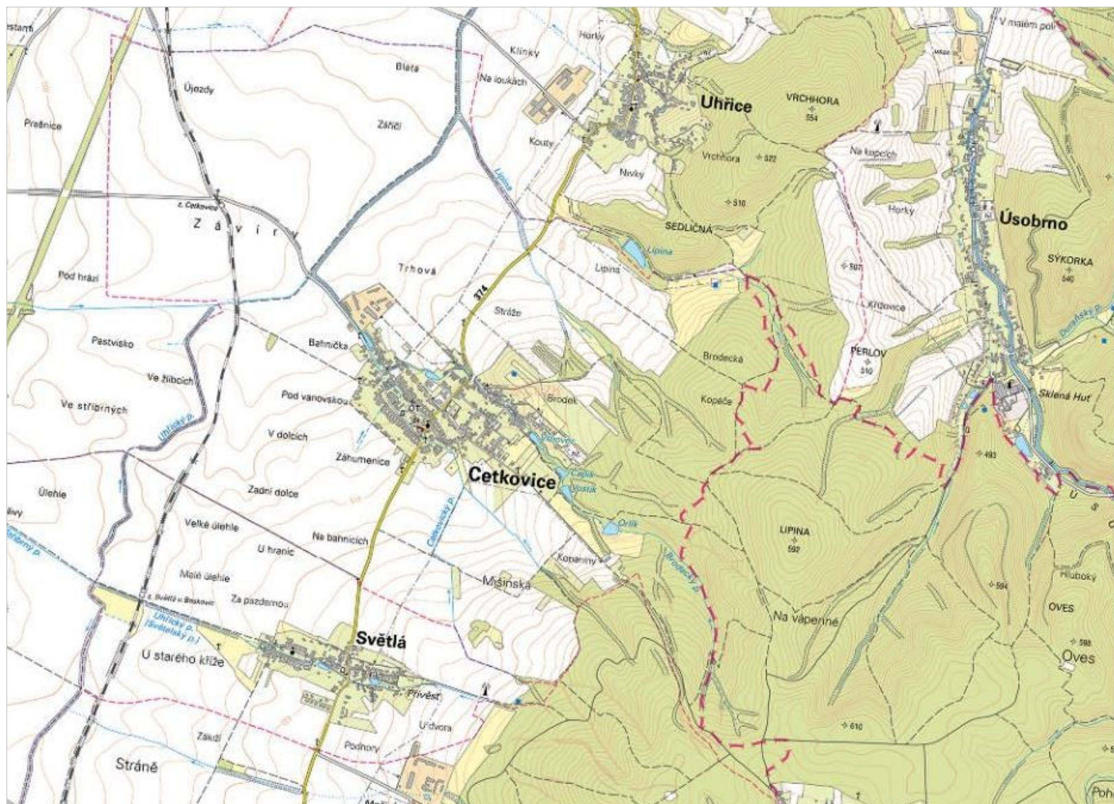
SCHEMA K.Ú. CETKOVICE