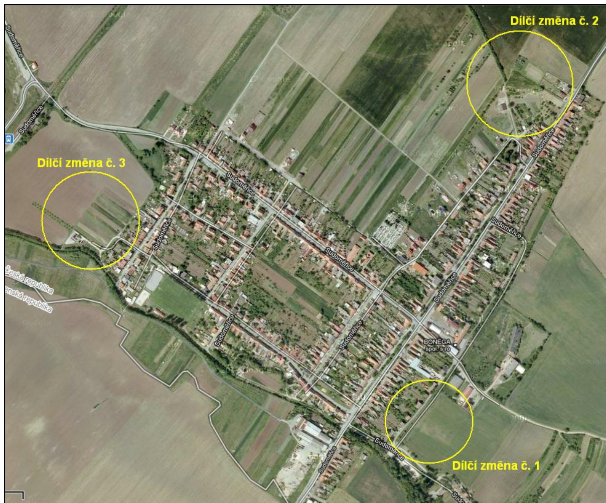
Obr. 1: Schéma navržených zastavitelných ploch (součástí není dílčí změna č. 4, která nemá dopad do grafické části (úprava regulativů) a dílčí změna č. 5, kterou jsou zapracovány plochy a koridory vyplývající z územně plánovací dokumentace vydané krajem)