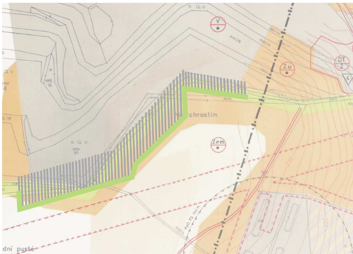
Obrázek 2: výřez z výkresu „Regulace, funkční zonace, veř. prospěšné stavby“ ÚPN SÚ Těmice s vyznačením požadovaného rozšíření skládky Těmice, zakončeného požadovaným přetrasováním lokálního biokoridoru.