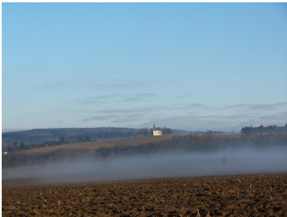
Pohled ze stanoviště C: Lepiny