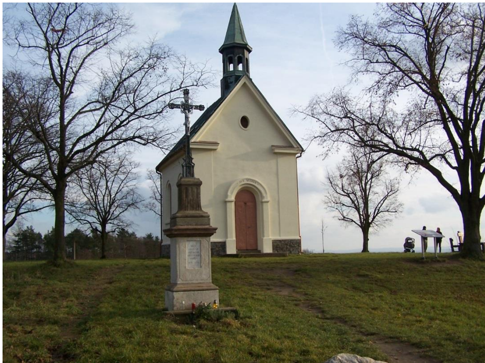
Pěší přístup k poutnímu místu a vyhlídce