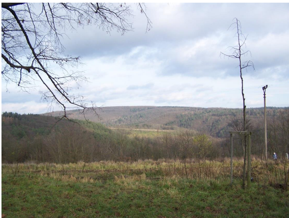
Velkomoravské Staré Zámky