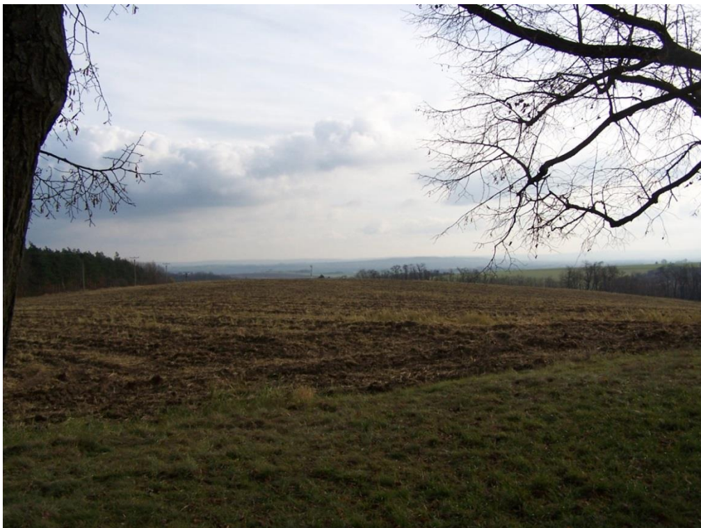
Památník Žuráň /Slavkovské bojiště tří císařů/