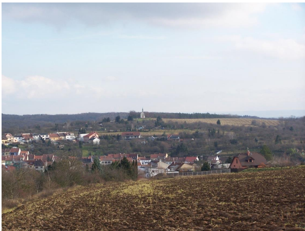
Pohled ze stanoviště A: Novolíšeňská – Podbělova

Stanovená místa pro zákresy do fotografií: