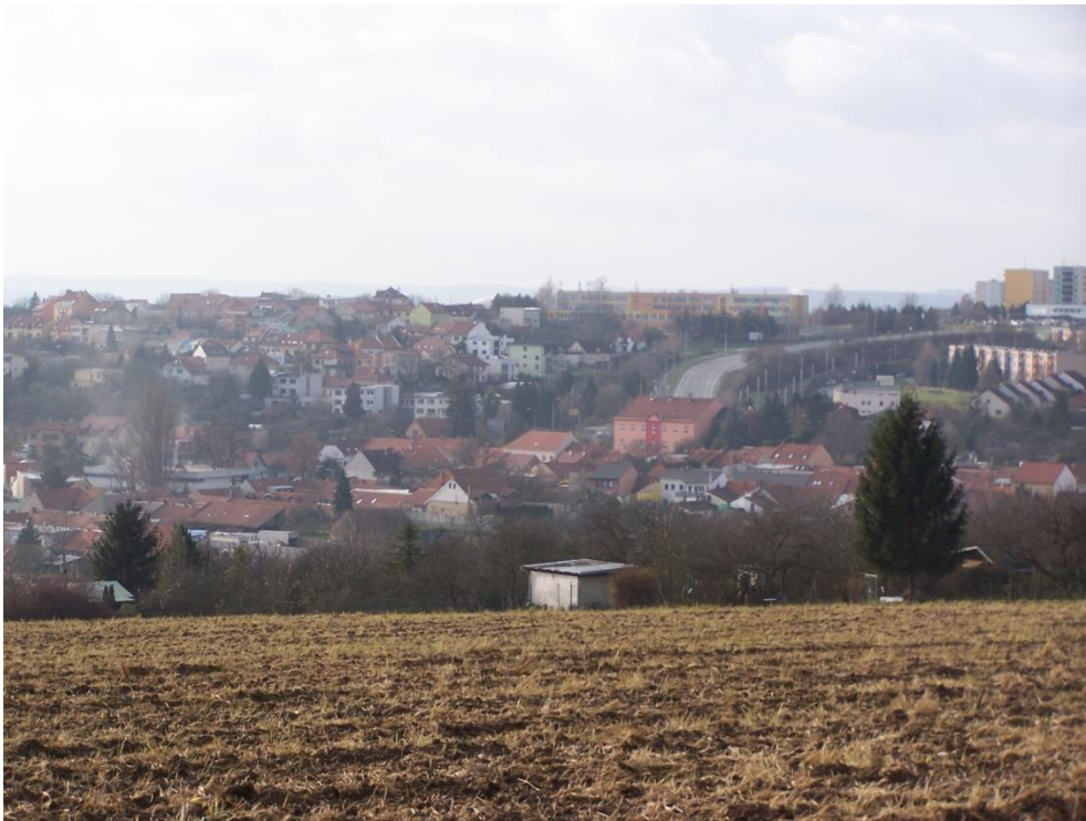
Centrální část MČ: Náměstí Karla IV.- Střední zdrav.škola