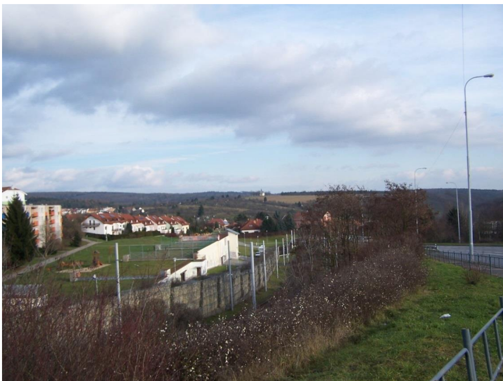
Pohled ze stanoviště B: Mifkova - Novolíšeňská