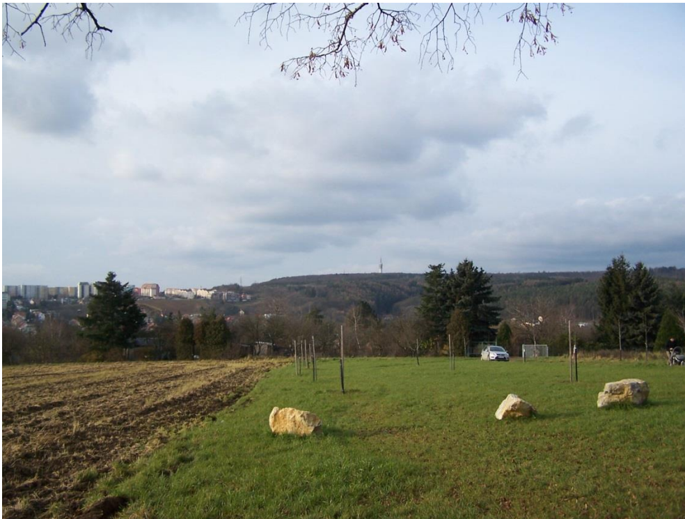
Panorama Sídliště Líšeň – lesní masiv Hády