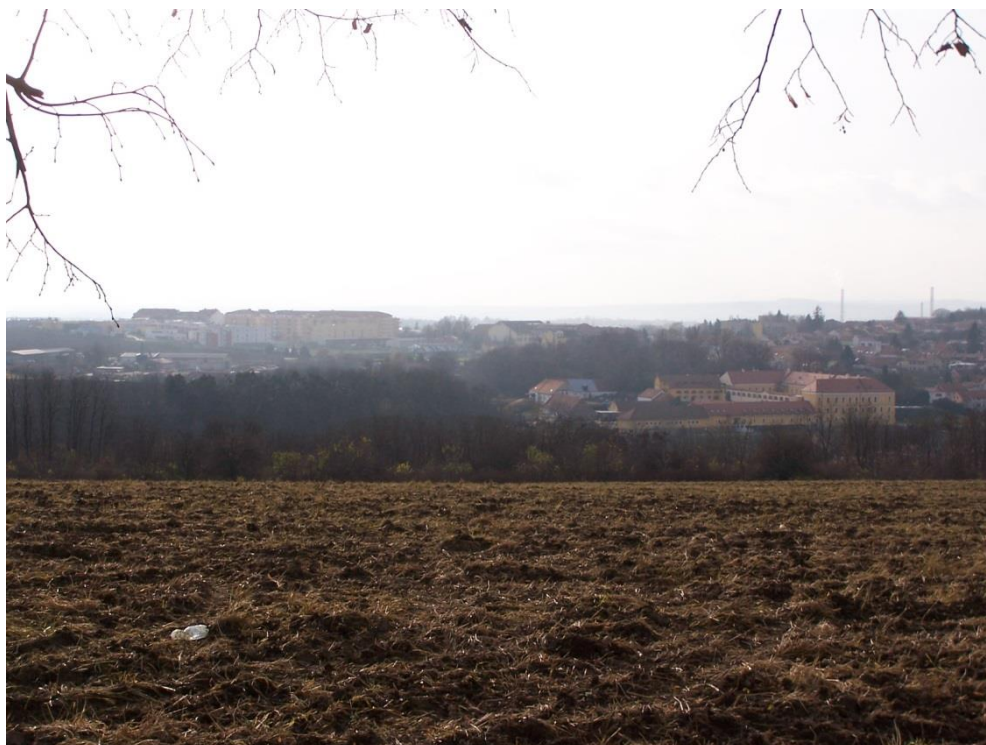
Panorama stávající zástavby /Lepinky-Zámek Belcredi/