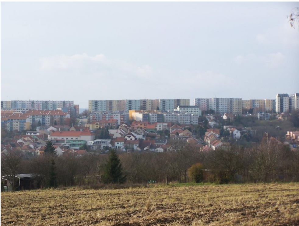
Centrální část MČ: Dělnický dům – sídliště Líšeň