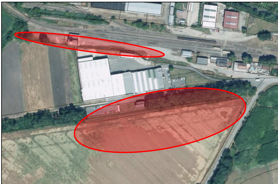
Ortoto – schéma zájmového území v přímé vazbě na areál spol. LISI AUTOMOTIVE FORM a.s.