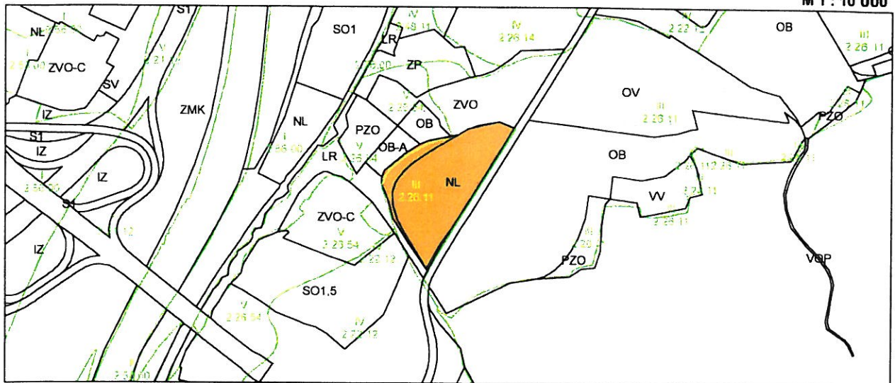
Zákes zadání změny schválený usnesením ZHMP č 13/30 ze dne 24.1.2008, s vyznačením hranic BPEJ