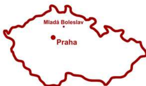
Obr. 1: Geografická poloha města Mladá Boleslav

Severní sídliště se rozprostírá od historického centra směrem na sever až k okraji města Mladá Boleslav (Obr. 2), kde hraničí s městem Kosmonosy. Rozloha zóny je cca 105,5 ha s obvodovou délkou téměř 5,5 km. Hraničními ulicemi zóny jsou na jihu ulice Čechova a Erbenova, na západě Na Radouči, severní okraj je lemován ulicemi 17. listopadu a Mládežnická a východ je ohraničen třídou Václava Klementa a ulicemi Jana Palacha, Havlíčkova a Palackého. Vnitřní část lokality zahrnuje ulice Sadová, Václavkova, U Stadionu, U Penzionu a Jiráskova. Výše uvedené ulice spadají do městské části Mladá Boleslav II. Vymezené území tvoří hlavní sídelní centrum města. Vymezení zóny Severní sídliště je zobrazeno na obrázku 3.