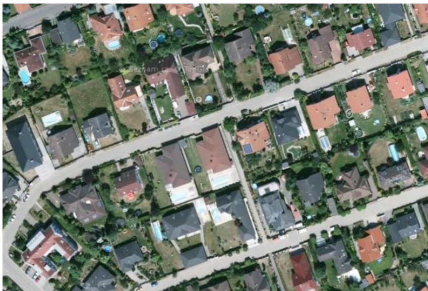
Kompaktní propustná struktura zástavby – zástavba rodinných domů v části Rudná – jih (ul. Na výsluní)