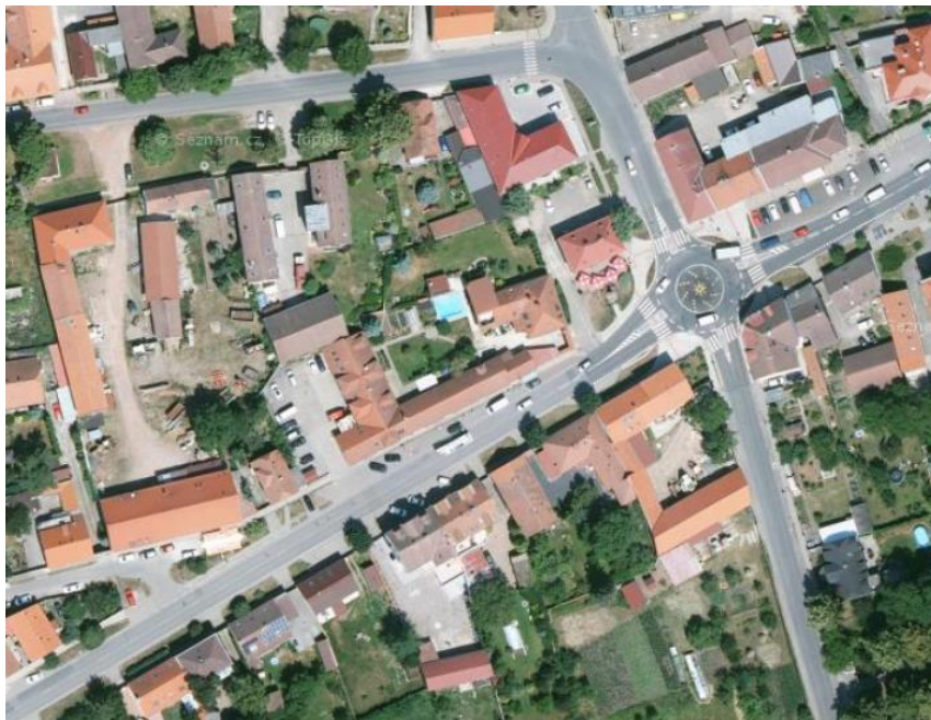
Kompaktní bloková struktura zástavby – centrum města Rudná