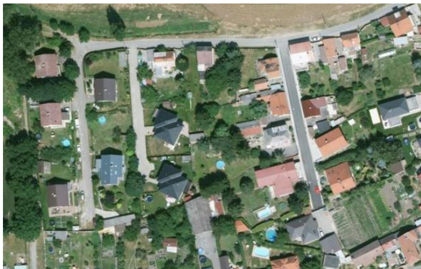
Rozvolněná struktura zástavby – Rudná – sever, rodinné domy pod ul. Rybničná