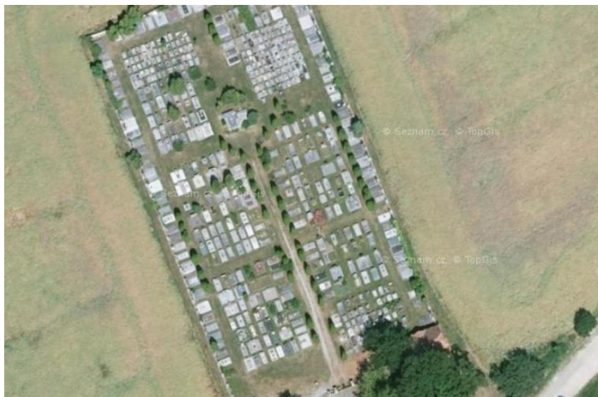
Drobná solitérní struktura zástavby – hřbitov nad ul. Růžová