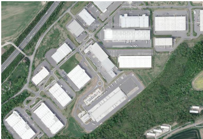
Areálová struktura zástavby – logistický park ProLogis Rudná – západ