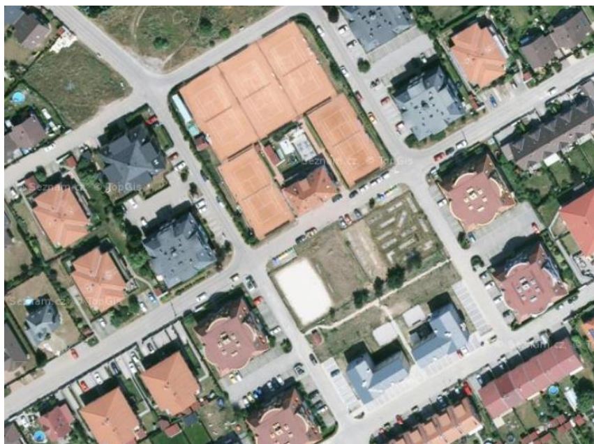
Volná struktura zástavby – bytové domy okolo Hořelického nám.