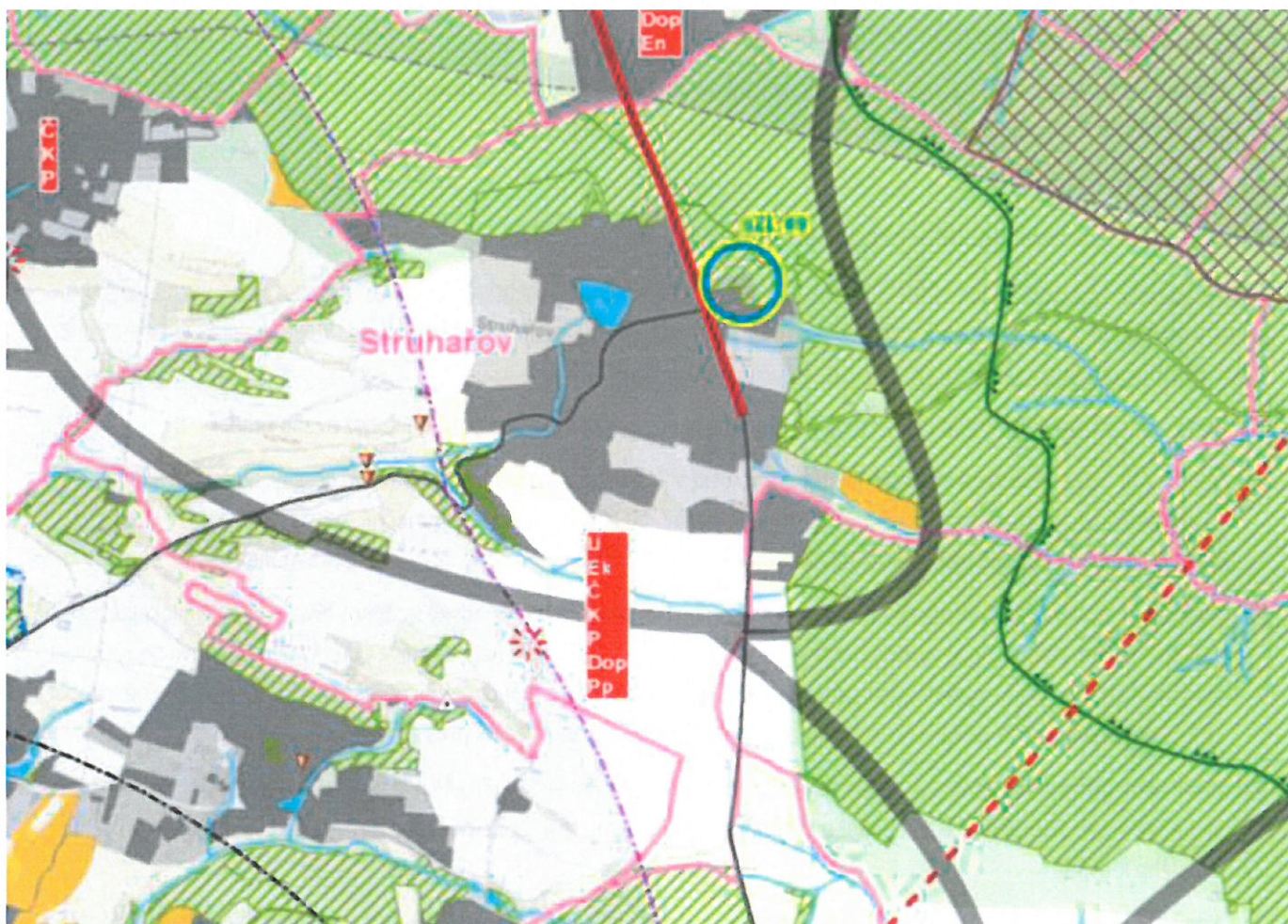
Obrázek 1: Výřez z výkresů záměru dle ÚAP ORP Říčany pro správní území Struhařova