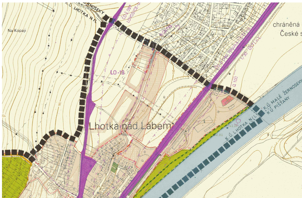
Obr. 11 - Výřez z hlavního výkresu ÚPNŠÚ Lovosice, Lhotka nad Labem, Lukavec

Další zdůvodnění zastavitelných ploch je uvedeno v kapitole i.2 tohoto odůvodnění územního plánu.