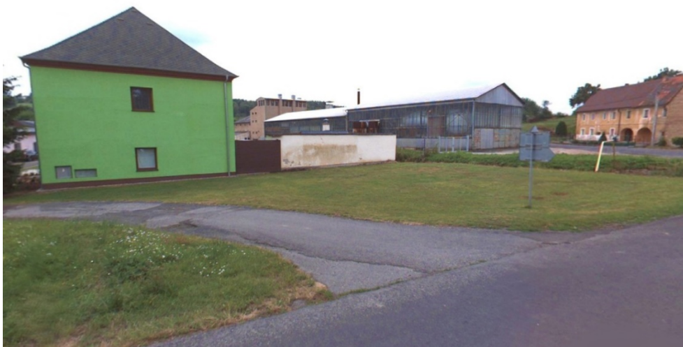
Obr. D.2 řešené území (zdroj mapy.cz)

2) Jedná se o změnu územního plánu z vlastního podnětu ve smyslu § 44 písm. a) stavebního zákona, jejíž navrženým obsahem je (cit.) „změna textové části splaškové odpadní vody o rozšíření možnosti vybudování domovních čistíren odpadních vod v obci Drahozub a změny varianty vybudování nové čistírny odpadních vod za Úštěckým potokem při místní komunikaci p.č. 1604 na pozemku p.č. 329/19 a p.č. 329/20.“