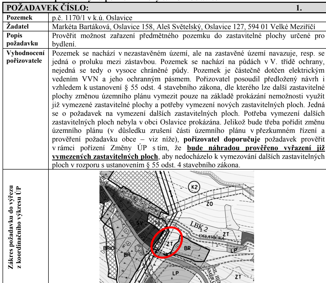
Tabulka č. 2: požadavky na pořízení Změny č. 1 ÚP Oslavice

Během platnosti Územního plánu Oslavice bylo vzneseno ze strany vlastníků pozemků a obce Oslavice, zastoupené starostou Ing. Pavlem Janouškem, několik požadavků (viz následující tabulka č. 2) na pořízení Změny č. 1 ÚP Oslavice.