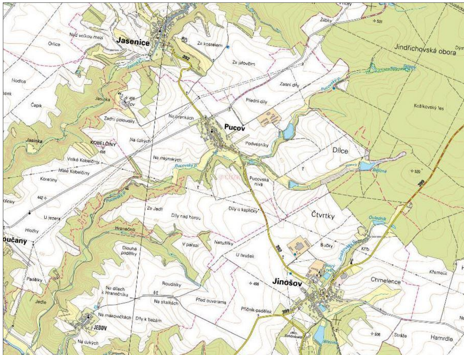
SCHEMA K.Ú. PUCOV