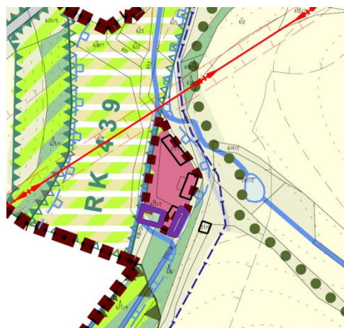
Výřez z ÚP