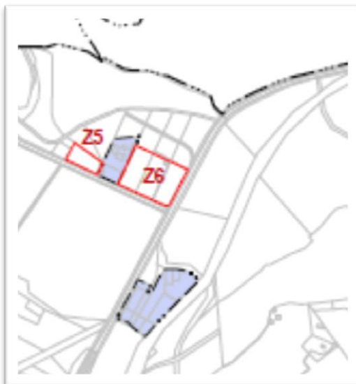
Obr. 3: Výřez z výkresu ZČÚ, vyznačené zastavitelné plochy v právním stavu.

Následující tabulka byla zhotovena podle údajů doložených z registru stavebního úřadu a po konzultaci se starostkou obce Oslavička.