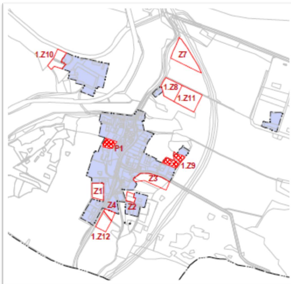
Obr. 2: Výřez z výkresu ZČÚ, vyznačené zastavitelné plochy v právním stavu.

V urbanistické koncepci jsou navržené zastavitelné plochy vymezeny v návaznosti na zastavěné území. Územní studie se v ÚP nestanovuje. Celkem ÚP vymezuje 11 zastavitelných ploch a 2 přestavby, z nichž 10 ploch má charakter bydlení. Dvě zastavitelné plochy určené pro výrobu a skladování a jedna zastavitelná plocha pro zemědělskou výrobu. Vyhodnocení navržených zastavitelných ploch je uvedeno níže v tabulkovém vyhodnocení. V ÚP je stanovena etapizace na zastavitelné ploše Z3 a Z4. Na zastavitelné ploše Z4 nebyla při povolování staveb etapizace dodržena. V ÚP není vymezena žádná územní rezerva, ani do území nespadá žádná územní rezerva, která by zasahovala na území obce z nadřazených dokumentací (ZÚR KrV, PÚR).