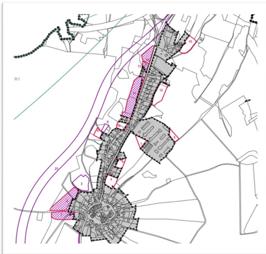
Obr. 1: Zastavitelné plochy vymezené platným ÚP.