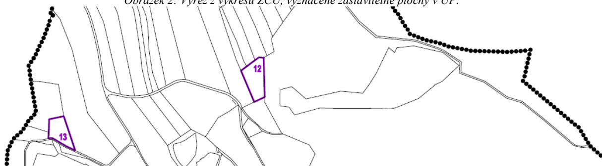
Obrázek 3: Výřez z výkresu ZČÚ, vyznačené zastavitelné plochy v ÚP.

V obci byla povolena výstavba dvou vodních ploch, mimo vymezení zastavitelné plochy. Jedna vodní plocha vznikla jižně od rybníka Pradlán a druhá je v realizaci výstavby rybníku „Musílek“, který bude situován v kaskádě rybníků v lokálním biocentru LBC Pastýřík.