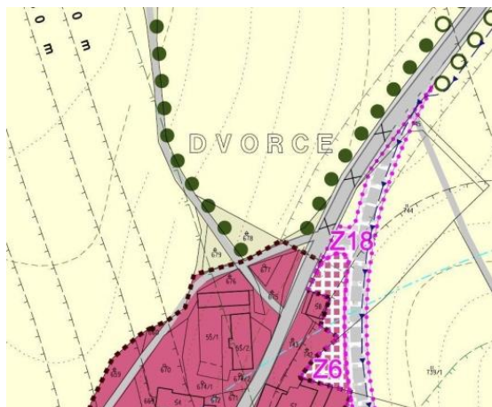
Výřez z ÚP

Z2.1 - Prověřit možnost vymezení návrhové plochy SV - plochy smíšené obytné venkovské v místní části Dvorce - pozemky p. č. 678 a 629/8 k. ú. Kyjov u Havlíčkova Brodu.