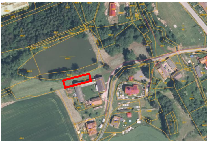
Zákres ortofoto + K

Výčet parcel výše uvedené změny je orientační, rozsah změny v území se může od uvedeného parcelního vymezení lišit.