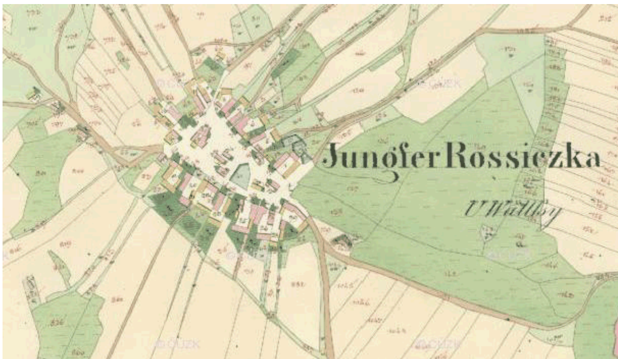
Panenská Rozsíčka 1835

O pořízení nového územního plánu bylo rozhodnuto usnesením zastupitelstva obce Panenská Rozsíčka ze dne 13. 2. 2017.