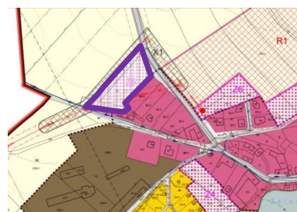
Zařazení do II. etapy výstavby (plocha Z5)

V rámci zvolené urbanistické koncepce změny územního plánu mohou být ve změně územního plánu vymezeny i další plochy s rozdílným způsobem využití.