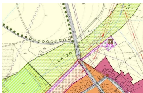
Výřez z ÚP

Změnou bude provedena aktualizace zastavěného území.