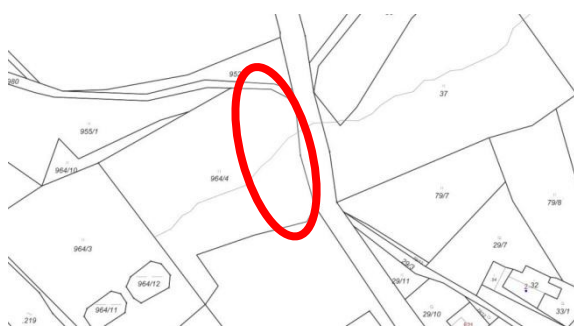
Snímek mapy KN

Z3.2 - Prověří možnost vymezení zastavitelné plochy technické infrastruktury na západním okraji obce Vysoká umožňující výstavbu ČOV - část pozemku parc. č. 964/4 v k. ú. Vysoká. Původně vymezená plocha Z13 bude navržena do ZPF.