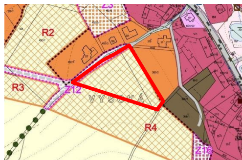
Výřez z ÚP

Z3.2 - Prověří možnost vymezení zastavitelné plochy technické infrastruktury na západním okraji obce Vysoká umožňující výstavbu ČOV - část pozemku parc. č. 964/4 v k. ú. Vysoká. Původně vymezená plocha Z13 bude navržena do ZPF.