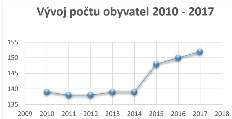
Obr. 3: Graf vývoje počtu obyvatel v obci Skřínářov, data jsou vždy k 31.12. (Zdroj: Český statistický úřad; http://vdb.czso.cz/ ).