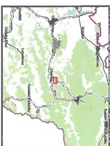
Širší vztahy (Zlínský kraj)